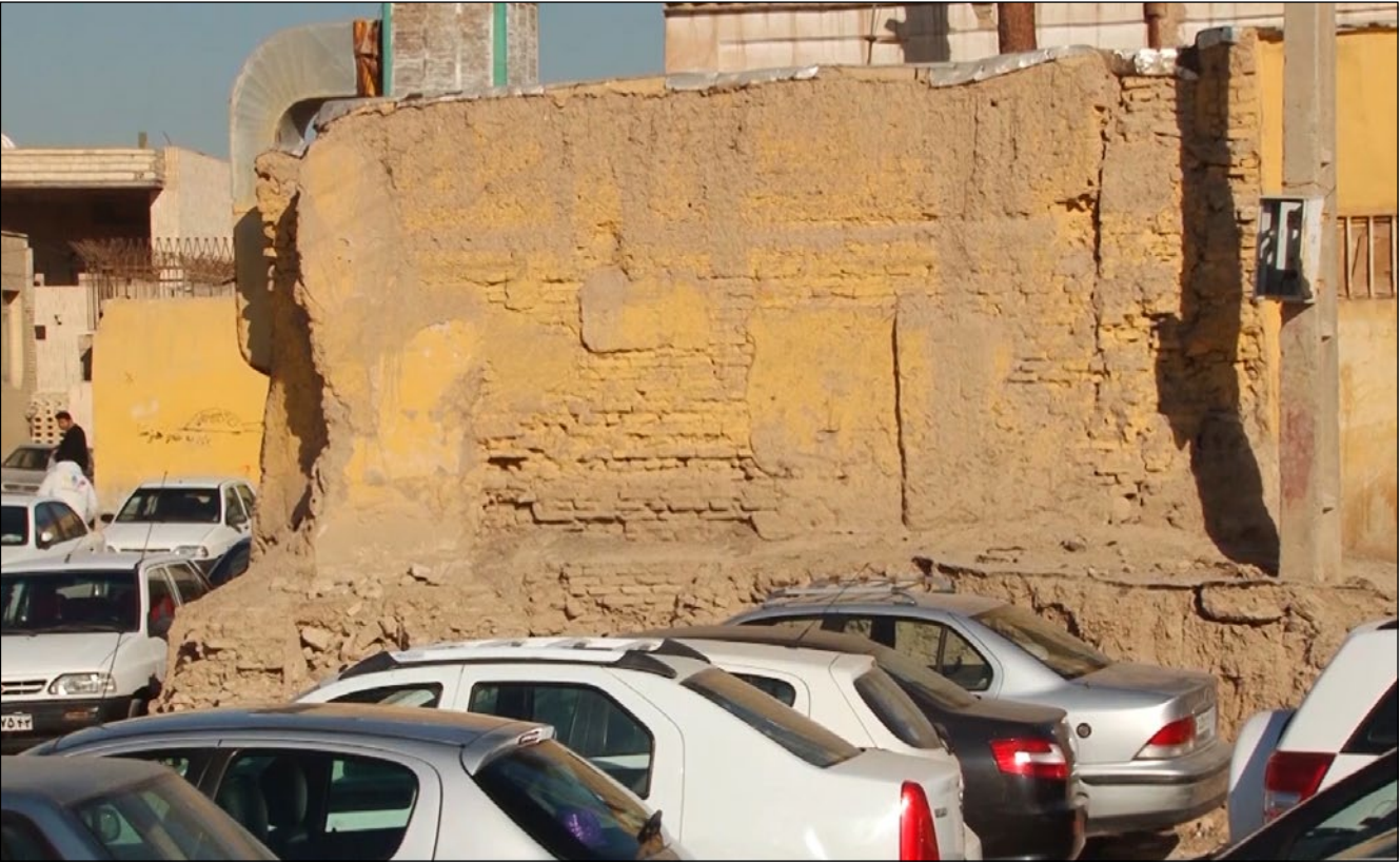
بازرسی میراث فرهنگی اصفهان

ماجرا به چند سال قبل باز می‌گردد. دعوا میان شهرداری و میراث فرهنگی استان اصفهان بود. قرار بود در طرح مدیریت شهری اصفهان، بافت تاریخی میدان نقش جهان به گذری تبدیل شود که معضلات ترافیکی در آن رفع شود. گذر در فاصله ۵۰ متری از مسجد شیخ لطف الله بود. بر اساس طرحی که معاونت شهرسازی شهرداری اصفهان ارائه کرده بود، گذر آقا نورالله نجفی قرار بود به‌صورت یک پیاده راه از بازار موجود ادامه پیدا کند و با احداث یک گذر ۴ متری دسترسی محلی فراهم شود.