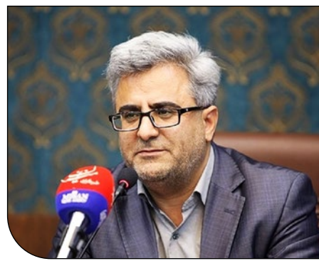
ولی تیموری معاون گردشگری وزارت میراث فرهنگی: