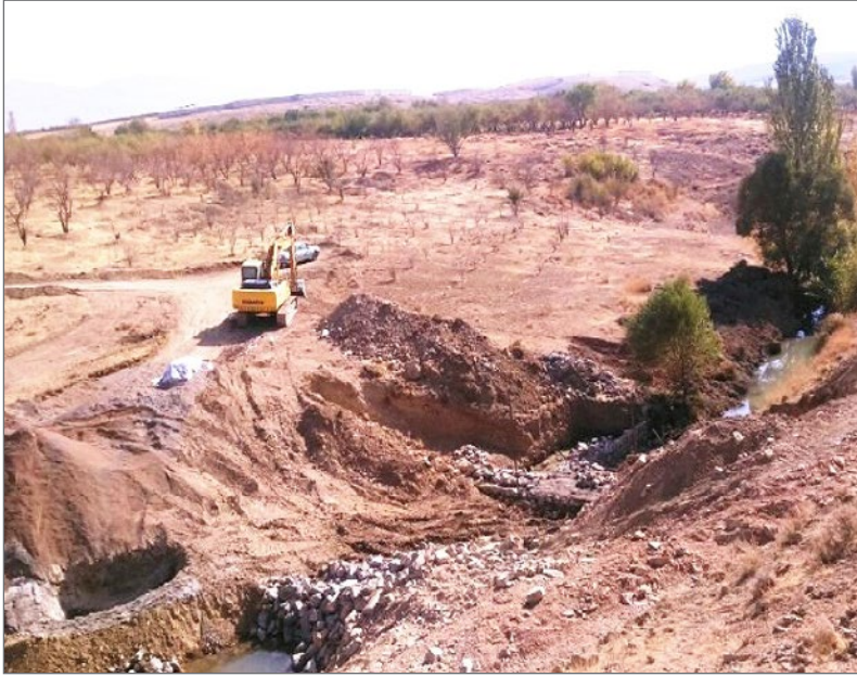
خواهد گرفت وهم می توان سیلاب ها و رواناب را کنترل واز مهاجرت مردم به شهرها جلوگیری کرد.