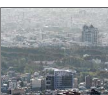
تهران، پایتخت ایران

که جابه جایی این درختان موفقیت آمیز خواهد بود.این مسئول اضافه کرد: متأسفانه چون قانون اجباری برای شهرداری در خصوص استعلام و اخذ نظر از محیط زیست در فرایند اجرای پروژه‌های شهری قرار نداده، شهرداری هم نسبت به این موضوع بی تفاوت است و به تبعات زیست محیط زیستی پروژه‌هایی که در شهر اجرا می‌کند توجه چندانی ندارد.