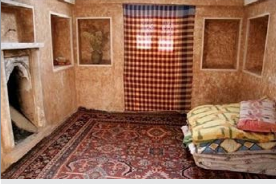
گردشگری فقط ایجاد یک اقامتگاه و تامین خوراک گردشگر نیست و هزاران شاخه شغلی به گردشگری وابسته است