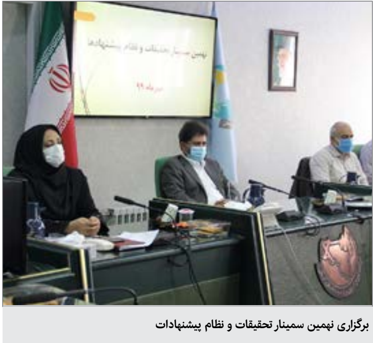
برگزاری نهمین سمینار تحقیقات و نظام پیشنهادات

وی ادامه داد: بیشترین طرح‌های افتتاحی در روستاهای استان سمنان به مناسبت روز ملی روستا و عشایر مربوط به دهیاری‌های استان است. وی بیان کرد: ۱۵ طرح از مجموع ۷۰ طرح عمرانی بهره‌برداری شده به مناسبت روز ملی روز و عشایر در روستاهای استان سمنان مربوط به دهیاری‌ها است. صمیمیان اظهار داشت: ۳۹ میلیارد و ۱۶۹ میلیون ریال برای افتتاح ۱۵ طرح دهیاری‌های استان سمنان هزینه شد و ۱۵ روستای استان با جمعیت ۱۷