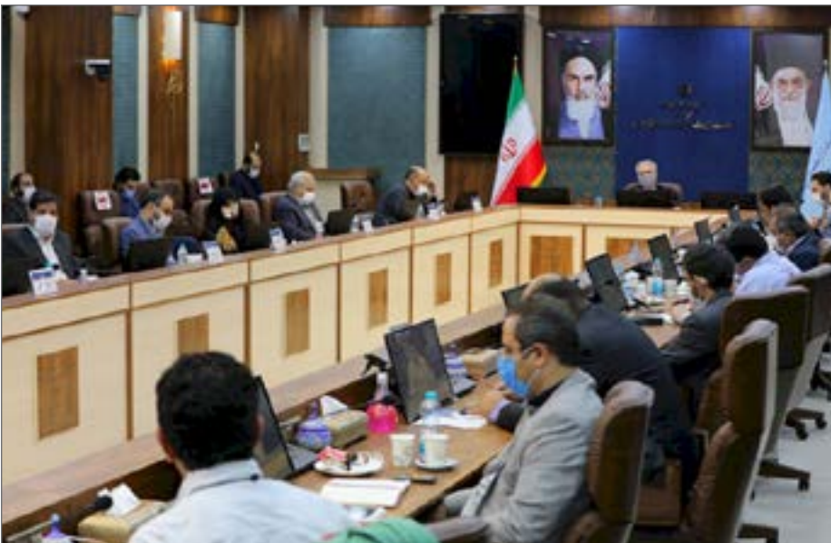
صدور کارت برای میراث‌بانان افتخاری برای جلوگیری از سوءاستفاده سخت‌گیرانه شده است

انجام می‌دهیم. در گام اول از همان ابتدای شیوع کرونا بسته اول حمایتی را به‌سرعت آماده کردیم که عمدتاً استمهال، امهال وام‌ها و پرداخت‌های مالیاتی، بیمه و... بوده است.» او بیان کرد: «تصویب این بسته حمایتی موضوع مهمی بود، شیوع کرونا با آسیبی که به کسب‌وکارها زده موجب شده تا بسیاری از افراد تحت فشار قرار بگیرند، بسیاری از افراد در قالب اقامتگاه‌های بوم‌گردی از وام اشتغال روستایی استفاده کرده بودند. منتظر هستیم مصوبه به شکل رسمی به دست ما برسد، به‌زودی جزئیات آن‌چه را که در ستاد ملی مقابله با کرونا تصویب شده، به صورت دقیق به اطلاع می‌رسانیم. به هر حال گام سوم مهم است و خدا را شکر با پیگیری‌های زیادی که به همراه معاون گردشگری کشور در دولت انجام دادیم و در ستاد ملی مقابله با کرونا نیز تأیید شده، این موضوع انجام شود.» وزیر میراث‌فرهنگی، گردشگری و صنایع‌دستی درباره موضوع اعتماد به بخش خصوصی و غیردولتی که توسط رئیس فراکسیون گردشگری مجلس در این نشست مطرح شد، گفت: «تنها وزارتخانه‌ای هستیم که همه کارهای ما به دست بخش خصوصی انجام می‌شود، من از بخش خصوصی به دولتی آمدم، همیشه تلاش می‌کنم به بخش خصوصی کمک کنم. خوشبختانه ریشه امور اجرایی این وزارتخانه به دست مردم است.»