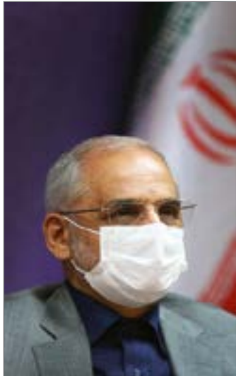
وزیر آموزش و پرورش در دیدار با مدیران مدارس

می‌دهد تاکنون فعالیت‌مدارس برسیر کرونا تاثیرگذار نبوده و آمار و ارقام کنونی هم این‌را نشان می‌دهد ضمن آنکه باید عنوان کرد که ظرفیت دانش آموزان در مدرسه کامل نیست و هم اکنون ۱۰ درصد حضور دانش آموزان در مدارس را داریم. وزیر آموزش و پرورش با اشاره به اینکه حضور و یا عدم حضور دانش آموزان در مدارس وابسته به رای ستاد ملی کرونا و تشخیص وزارت بهداشت است، افزود: هر زمان تشخیص دهند در هر منطقه ای که حضور دانش آموزان برای سلامتی زیان بار باشد، فعالیت مدارس غیر حضوری می‌شود.