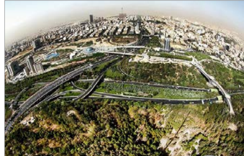
اراضی سبز عباس آباد با ۵۶۰ هکتار وسعت بین بزرگراه‌های مدرس، حقانی، همت و رسالت واقع شده است

«تپه‌های عباس آباد» خال سبز تهران اغلب آلوده و پرترافیک است، تفرجگاهی که سازه‌ها و محوطه‌های بزرگ مقیاس را در دل خود جای داده است، از برج پرچم ۱۵۰ متری گرفته تا یک پیست اسکی که می‌گویند در خاورمیانه بزرگترین است. ساخت‌وساز در اراضی عباس آباد درحالی ادامه دارد که نگرانی و دغدغه‌ها نسبت به افزایش بار ترافیکی در محدوده این تفریحگاه، جدی‌تر شده است. به گزارش ایسنا، اراضی سبز