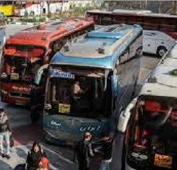
«سفرکارت» عنوان تازه‌ای در موضوع تسهیلات ارزان قیمت سفر نیست