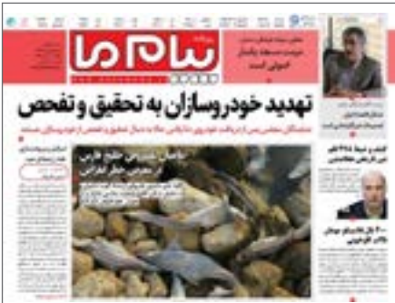
پیام ما دینور

مرمت نصب داربست در چند نقطه، قرار دادن بتر و چسباندن کاغذهایی کوچک با عنوان «کارگاه مرمت» در کنار دیوارهای کاشی در حیاط کاخ گلستان، از فعالیت مستمر مرمتگران در بخش های مختلف این کاخ جهانی خبر می دهد.