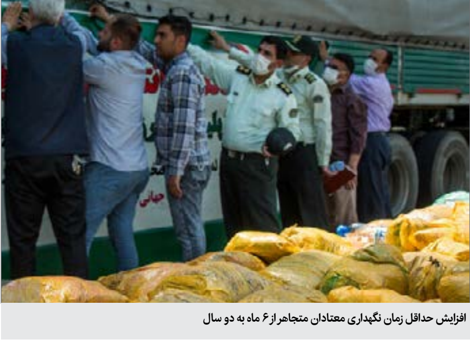
افزایش حداقل زمان نگهداری معتادان متجاهر از ۶ ماه به دو سال

-مدیرکل دفتر حقوقی و امور مجلس ستاد مبارزه با مواد مخدر کشور در گفت‌وگو با ایسنا، با تأکید بر اینکه بهترین قوانین بعد از گذشت چند سال، نیازمند بازنگری هستند، اظهار کرد: مبارزه با مواد مخدر امروزه جهان شمول شده است، اما ایران نسبت به سایر کشورها در شرایط ویژه‌تری قرار دارد؛ ما در همسایگی کشور هستیم که بزرگترین تولیدکننده تریاک در جهان است و تولیدات مواد مخدر آن طی ۱۰ سال گذشته ۵۰ برابر شده است. ما در همسایگی کشوری هستیم که حامیان فرامرزی و فراملی دارد که ادعای