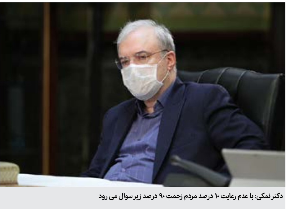
دکتر نمکی: با عدم رعایت ۱۰ درصد مردم زحمت ۹۰ درصد زیر سوال می رود

گزارش کرونا خیال رفتن ندارد. مخصوصا حالا که رعایت فاصله اجتماعی و استفاده از ماسک هم کمتر شده است، کسانی که رعایت نمی کنند سهم بیشتری در شیوع جدید دارند. کادر درمان در بیمارستان‌های کشور بیشترین صدمه را دیده‌اند. هنوز از زیر بار موج دوم کرونا شانه خالی نکرده‌اند که باید تخت‌ها را برای موج سوم آماده کنند. علیرغم توصیه مداوم کارشناسان حوزه سلامت اما گویی گوش درصد قابل توجهی از مردم نسبت به درخواست‌ها برای مراعات کردن صل اساس استفاده از