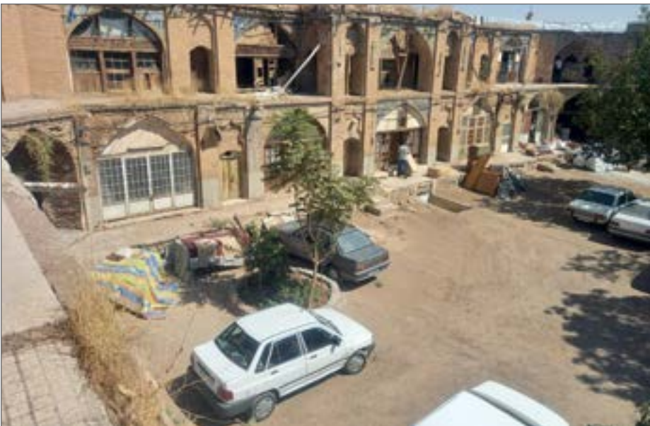
کعبود اعتبارات میراث فرهنگی، ماتیعی بر سرراه مرمت و ساماندهی سرای وزیر

وی با اشاره به نشست بخشی از دیوار این بنای تاریخی، گفت: برای جلوگیری از رفت و آمد از کنار این