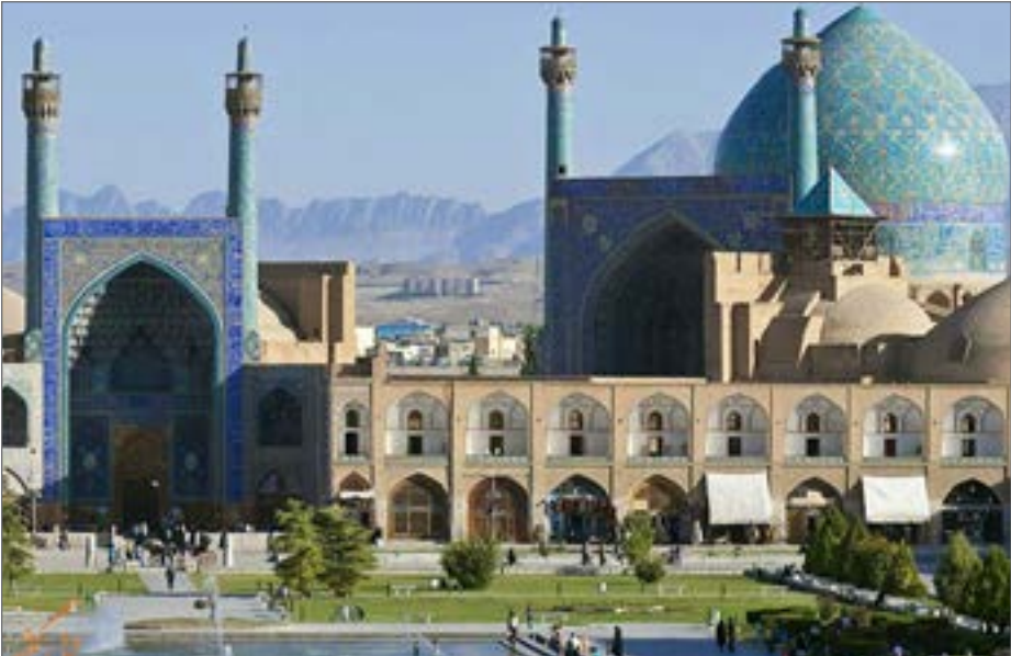
آغاز عملیات دفع رطوبت از بخش‌های مختلف مسجد امام

دهه‌های گذشته به تدریج حتی به میزان ۱۰۰ درصد دچار بحران حفاظتی بودند که از آن جمله می‌توان به مسجد تاریخی امام (ره) (جامع عباسی) در محور جنوبی مجموعه جهانی میدان امام (ره) (نقش جهان) اشاره کرد. او افزود: این مسجد تاریخی با حدود ۱۶ هزار مترمربع وسعت، طی یک دهه گذشته دچار مضعلات فراوانی بود که از آن جمله می‌توان به نفوذ رطوبت در دیوارهای جنوبی و شرقی مسجد، انسداد مجاری دفع