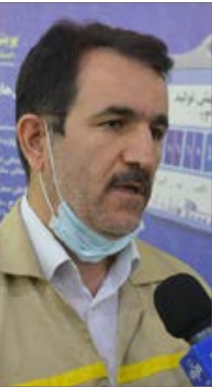
مدیر عامل شرکت برق منطقه ای خوزستان