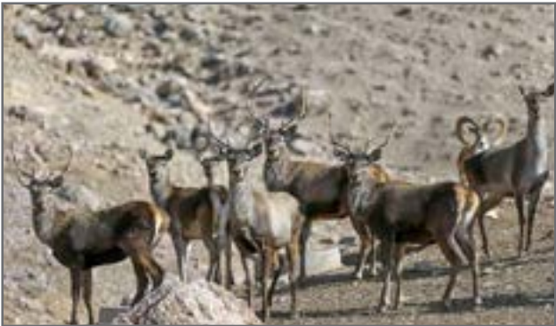
مرغ در ایران

استان از فعالیت سرمایه‌گذاران بخش خصوصی که واجد شرایط لازم برای حفاظت از مناطق مستعد و نیز طرح های تکثیر و پرورش حیات وحش