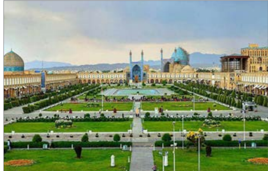
شهر تاریخی اصفهان از مناظر مختلف به ویژه در بخش میراث فرهنگی از شهرهای کم نظیر جهان اسلام است

سعدی نمونه‌هایی از این تخطی‌ها را به بهانه بازسازی، طعمه ساخت و سازهایی شده‌اند که به تأکید کارشناسان در صورت بی‌توجهی و ادامه این روند می‌تواند تبدیل به الگویی نادرست و مخدوش شدن هرچه بیشتر حریم دولتخانه صفوی، میدان نقش جهان و محور تاریخی فرهنگی اصفهان شود. ساخت مجتمع تجاری در خیابان استانداری که فراتر از حق مکتسبه موفق به دریافت مجوز ساخت سه طبقه زیرزمین و سه طبقه ساخت صد درصد شده، همچنین ساخت و سازهایی به بهانه بازسازی در گذر