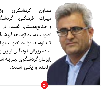
معاون گردشگری وزارت میراث فرهنگی، صنایع دستی و صنایع دستی، گفت: در پی تصویب سند توسعه گردشگری که توسط دولت تصویب و ابلاغ شده رایزنان فرهنگی از این پس رایزنان گردشگری نیز به شمار آمده و یکی شدند.