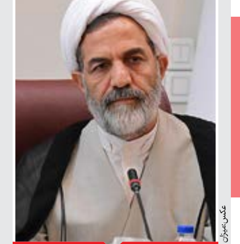
رئیس سازمان بازرسی: