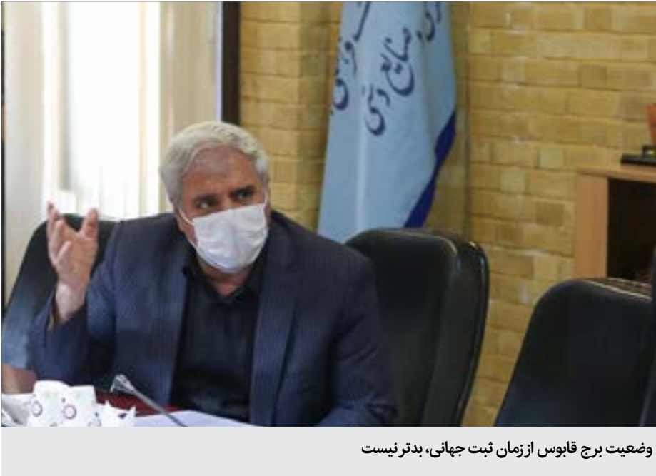
وضعیت برج قابوس از زمان ثبت جهانی، بدتر نیست

نظر وزیر میراث فرهنگی، گردشگری و صنایع دستی افتتاح کنیم. تمام این پروژه های مرمت بنا، موزه های محلی و منظره های هستند. افتتاح برخی از این پروژه ها بیش از ۴ سال زمان برده با توجه به بودجه بسیار اندکی که در اختیار داریم سعی می کنیم پروژه ها را اندک اندک پیش ببریم؛ به طور مثال موزه دوران اسلامی بیش از ۱۲ سال متوقف بود اما توانستیم آن را به سرمنزل برسانیم. افتتاح موزه ها به گونه ای نیست که بتوانیم بگوییم یک شبه تمام کارها انجام شده است؛ کارها طی سال ها متمادی انجام و به سر منزل می رسد. موزه خراسان نیز اساس فرایند طی شده قرار شد ۱۰۰ میلیارد تومان به میراث اختصاص یابد. با وجود آنکه اختصاص این بودجه از طرف تمام مسئولان مورد تایید قرار گرفته بود و حتی معاون اول رئیس جمهور نیز دستور اختصاص یافتن این بودجه را داده بود اما تاکنون این بودجه به میراث داده نشده است. نباید فراموش کرد، کارهایی که در خصوص خسارت هایی که سیل به میراث فرهنگی وارد کرده بود انجام شده است، مرمت های اضطراری بودند و مانند مسکن عمل می کنند. هنوز نگران آن هستیم که نتوانیم بودجه لازم برای مرمت های اساسی را تهیه کنیم. با اندک پولی که در اختیار داریم توانستیم کارهای اضطراری را در این خصوص انجام دهیم و کارهای استحکام بخشی و تثبیت انجام شده است اما نیاز است تا کارهای اساسی