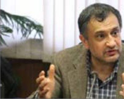
سقز سقز سقز

سلامتی افراد به همراه خواهد داشت، بیان کرد: امسال جلساتی را درباره مشکلات سال گذشته برگزار کردیم تا دواره شاهد افزایش آلودگی هوا در فصول سرما نباشیم.