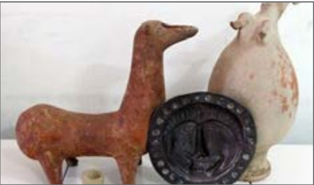
صنایع دستی سرایان