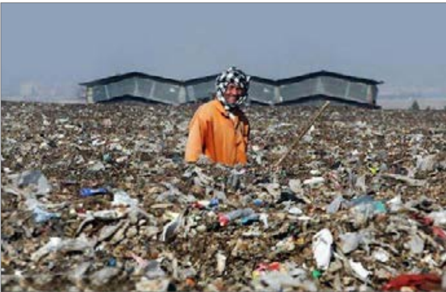
روزانه حدود ۶۰۰۰ تن پسماند در استان‌های ساحلی شمالی با سرانه هر نفر بیش از ۹۰۰ گرم در روز تولید می‌شود

در استان‌های شمالی کشور یکی از اولویت‌های دولت است، اظهار کرد: طی سال گذشته برنامه مدیریت پسماند در استان‌های شمالی با همکاری وزارت کشور، شهرداری‌ها و استانداری‌ها تهیه شد. در حال حاضر موضوع تأمین منابع مالی برای اجرای این برنامه بسیار مهم است. به گفته پسندیده روزانه حدود ۶۰۰۰ تن پسماند در استان‌های ساحلی شمالی با سرانه هر نفر بیش از ۹۰۰ گرم در روز تولید می‌شود و سهم قابل توجهی از پسماندهای عادی این استان‌ها مربوط به گردشگران است. مدیر کل دفتر مدیریت پسماند