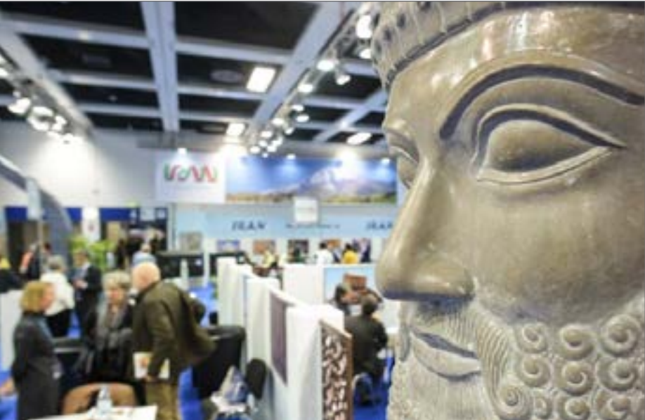
دفاتر اطلاع‌رسانی گردشگری در خارج از کشور بسته نشده، بلکه شیوه‌نامه آن درحال اصلاح و بازنگری است

در مشارکت با وزارت امور خارجه اجرا می‌شود به موضوع دفاتر اطلاع‌رسانی گردشگری اختصاص دارد. به هر حال تجربه ما در گذشته کم بوده که اینک درحال بازنگری آن هستیم و توقف فعالیت نمایندگان گردشگری ایران در خارج از کشور به معنی پایان این پروژه نیست. سجادی‌راد درباره مخالفت معاونت گردشگری با ادامه این پروژه و به مشارکت گرفتن سازمان فرهنگ و ارتباطات، رایزن های فرهنگی و وزارت خارجه گفت: به لحاظ اجرایی پیش آمده که مثلا سایر وزارتخانه‌ها از جمله صمت از زیرساخت و امکانات وزارت امور خارجه استفاده کرده باشند تا علاوه بر صرفه جویی مالی، مانع از موازی کاری در خارج از کشور شود و مأموریت اقتصادی را به سفرها محول کرده‌اند. از این دست توافق‌ها در امور اجرایی حاضر مساله مهم برای ما بازنگری و اصلاح شیوه‌نامه دفاتر اطلاع‌رسانی گردشگری است که از ظرفیت آن‌ها در جذب گردشگر بهتر بهره‌مند شویم. دفاتر اطلاع‌رسانی گردشگری، ایده‌ای بود که در دوره ریاست اسفندیار رحیم‌مشایی در سازمان میراث فرهنگی، صنایع دستی و گردشگری و