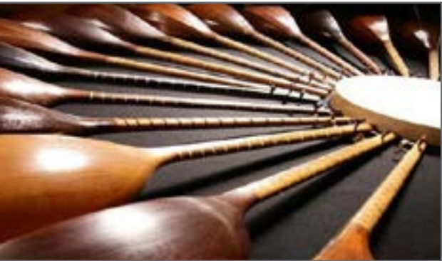
مدیرکل میراث فرهنگی، گردشگری و صنایع دستی خراسان رضوی

ارزشمندی در مسیر اعتلا و ارتقای کیفی فرهنگی در حوزه موسیقی تبرور بر جای گذارد، این اقدام چه بسا موجب تقار و تفرقه گردیده و خصومت اهالی مناطق مختلف استان را بر انگیزاند.