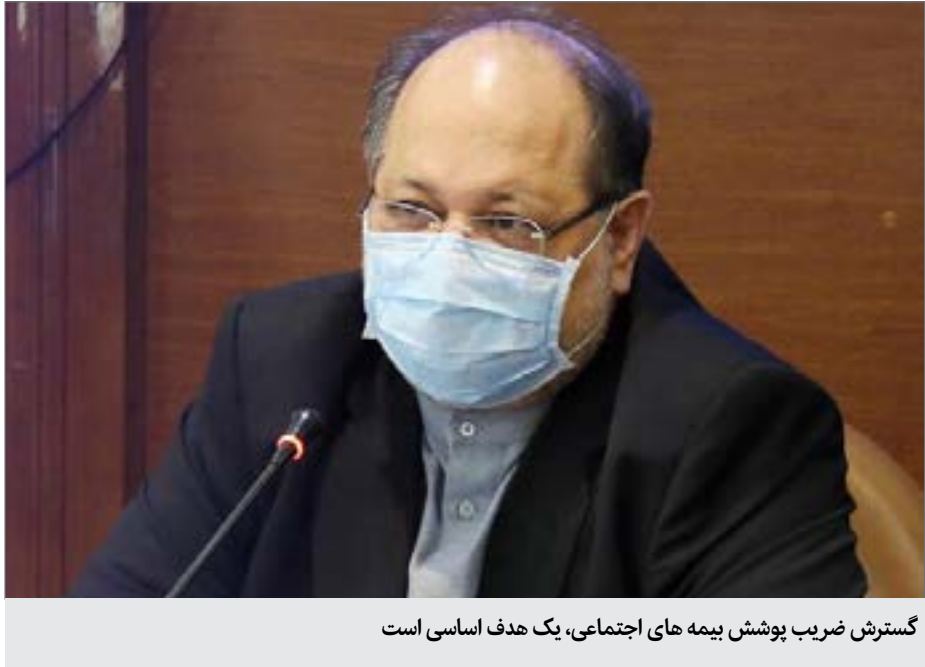
گسترش ضریب پوشش بیمه های اجتماعی، یک هدف اساسی است

خبرداد و گفت: با این اتفاق ۲۶ درصد به مجموع دریافتی مستمری بگیران صندوق افزوده خواهد شد. وی اضافه کرد: در دو سال اخیر با تلاش مدیران صندوق، ارزش دارایی‌های موجود از ۱۳ هزار میلیارد تومان به بیش از ۱۰۰ هزارمیلیارد تومان افزایش پیدا کرده است. وزیرتعاون، کار و رفاه اجتماعی با بیان اینکه مدیران صندوق بیمه اجتماعی کشاورزان، روستائیان و عشایر برای صیانت از منابع صندوق و دارایی‌ها روستائیان همه تلاش خود را کرده اند گفت: صیانت از