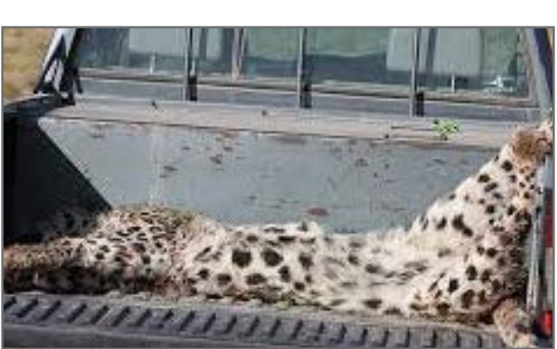
جانوری، نگهداری غیر مجاز از حیات وحش، حیوان آزاری، خرید و فروش سلاح و مهمات شکار و صید اشاره کرد.

در این مرکز مورد بررسی قرار می‌گیرد از طریق تماس‌های تلفنی شهروندان به ما اطلاع داده می‌شود. تصریح کرد: طی پنج ماه اخیر۳۵ مورد حیوان‌آزاری به ما گزارش داده شده است.