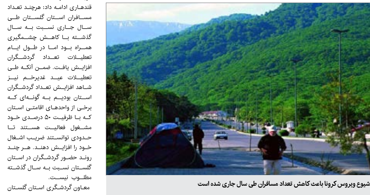
شیوع ویروس کرونا باعث کاهش تعداد مسافران طی سال جاری شده است

خبر معاون گردشگری استان گلستان اظهار کرد: هرچند تعداد مسافران استان گلستان طی سال جاری نسبت به سال گذشته با کاهش چشمگیری همراه بود اما در طول ایام تعطیلات تعداد گردشگران افزایش یافت. به گزارش خبرنگار ایلنا، درحالیکه همچنان آمار مبتلایان به کووید-۱۹ در ایران روزانه از دو هزار نفر کمتر نمی‌شود و همواره مسئولان وزارت بهداشت و درمان بر لزوم رعایت پروتکل‌های بهداشتی و بر عدم سفر به