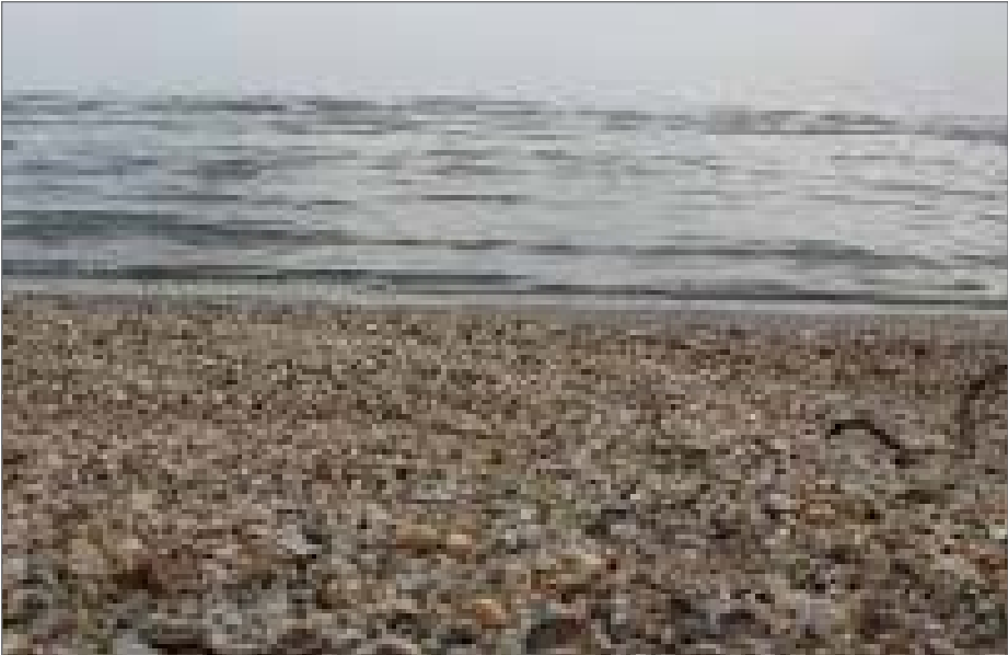
کیمدوب آب یکی از مشکلات مهم استراتژیک کشور شده و راه برون رفت از این چالش مدیریت صحیح منابع آب دریای خزر است

ایران دارای اقلیم متفاوتی است، کشوری که همزمان در یک نقطه آن می توان اسکی کرد و در نقطه ای