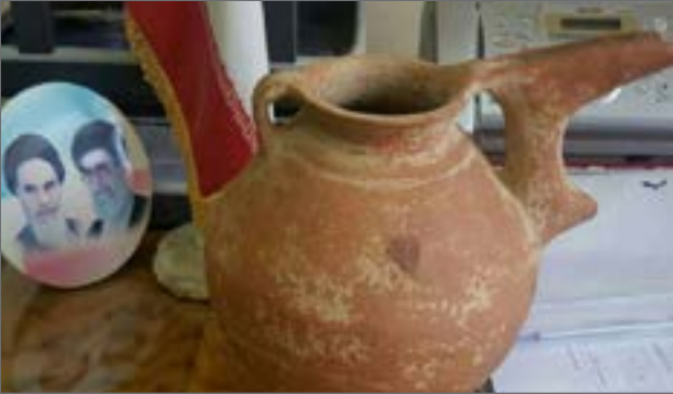
عمر: ۴۹۰۰ سال

عنوان کرد که از بچگی علاقه به گنج داشته و این کوزه قدیمی را در یکی از شهرهای غربی کشور پیدا کرده و برای فروش آن را به تهران آورده است.