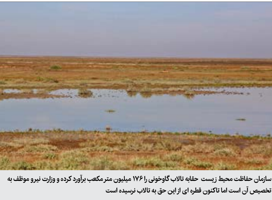
سازمان حفاظت محیط زیست حقایق تالاب گاوخونی را ۱۷۶ میلیون متر مکعب برآورد کرده و وزارت نیرو موظف به تخصیص آن است اما تاکنون قطره ای از این حق به تالاب نرسیده است