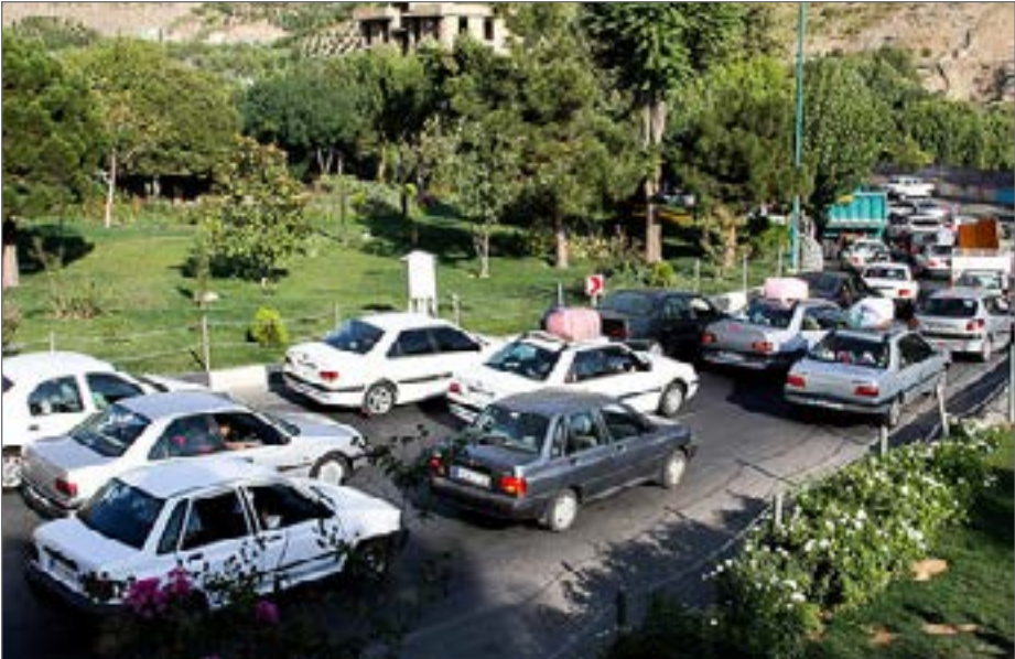
مازندران حدود دو هفته است در وضعیت قرمز کرونا قرار گرفته است

کنند. با این همه گزارش شده حجم ترافیک در محورهای شمالی کشور از روز گذشته زیاد شده است. معاون گردشگری وزارت میراث فرهنگی، گردشگری و صنایع دستی قبلا درباره مدیریت سفرها با وجود اخطار و توصیه‌های مکرر و محدود کردن فعالیت‌های گردشگری به ایستگاه گفته بود که ستاد ملی کرونا در این باره نظری را با معاونت گردشگری مطرح نکرده اما این مسؤولیت به استان‌ها محول شده که هر استان مطابق با شرایطی که دارد، تصمیم بگیرد. پیگیری‌ها نشان می‌دهد از بین استان‌های قرمز، فقط استان خراسان رضوی محدودیت‌هایی را برای سفر در تعطیلات پیش رو برقرار کرده است. در اطلاعیه‌ای که روابط عمومی اداره کل میراث فرهنگی، گردشگری و صنایع دستی این استان منتشر کرده، تأکید شده طبق مصوبه ستاد مقابله با کرونا در خراسان رضوی، هرگونه برگزاری توره‌های گردشگری و طبیعت‌گردی تا اطلاع ثانوی ممنوع است و آژانس‌های خدمات مسافرتی و جهانگردی از هر گونه تعهد الزام آور برای سفر جدا خودداری کنند. صرف‌نظر از این‌که این دستور باید زودتر ابلاغ می‌شد تا آژانس‌های به مسافران تعهدی ندهند و برای تور برنامه‌ریزی نکنند، مسأله قابل تأمل این است که فروش بلیت قطار، هواپیما و اتوبوس به مقصد