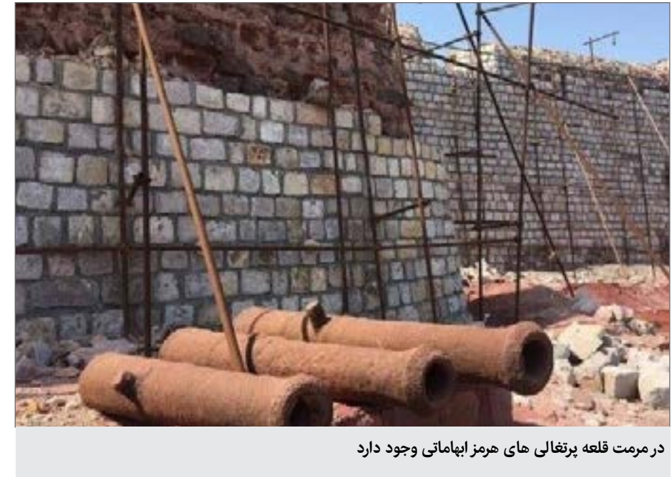
در مرمت قلعه پرتغالی های هرمز ابهاماتی وجود دارد

انتشار تصاویری از روند مرمت قلعه پرتغالی‌ها در جزیره هرمز در حالی به دغدغه دوستداران میراث فرهنگی تبدیل شده است که معاون میراث فرهنگی هرمزگان می‌گوید این مرمت اضطراری بوده و در صورت اشتباه بودن انتخاب مصالح، قلعه به حالت اولیه بازگردانده می‌شود. این قلعه‌ها با پلان چهار ضلعی نامنظم، دیوارهایی به قطر حدود ۳٫۵ متر و برج‌هایی به ارتفاع حدود ۱۲ متر در ۴ گوشه قلعه ساخته شده‌اند. قلعه پرتغالی‌های هرمز شامل انبارهای اسلحه، آب