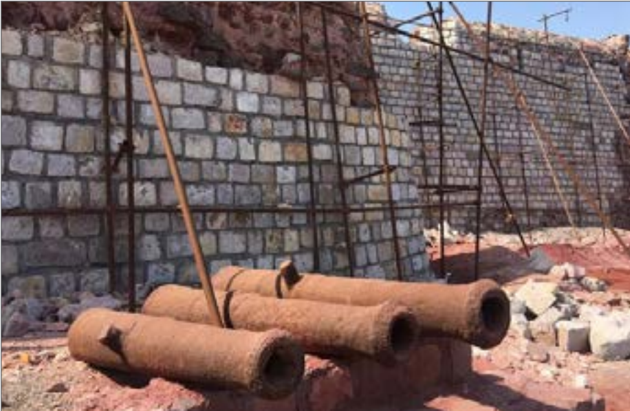
با خالی شدن زیر قلعه، آب به فرسایش شدیدتر قلعه کمک می‌کند

میراث نخست تصاویرش در فضای مجازی منتشر شد، چیزی شبیه به سیل‌بند در جاده‌ای که تنها هدفش انگار دفن تاریخ است! آجرهای سفید تازه چیده شده روی همدیگر، قد دیواره‌ی قلعه پرتغالی‌ها را خیلی بلندتر از دیواره‌ی اصلی بالا کشیده‌اند و داربست‌های زنگ زده چسبیده به تن دیوار حرف دیگری حالی‌اش نمی‌شود. به‌گزارش ایسنا، همه حرف‌ها از حفاظت، مرمت و ساماندهی قلعه ۴۰۰ ساله یعنی یکی از برندهای جزیره برای جذب گردشگر شروع شد؛ اما به نظر می‌رسد آخر و عاقبتش آن‌طور که باید خوب نیست، حالا که قرارها بر مرمت قلعه چرخیده گویا راه را اشتباه می‌روند، هر چند نمونه‌های زیادی از این نوع مرمت‌ها در بناهای تاریخی البته در گذشته‌ای - که توفعی از آن‌ها نبوده - وجود دارد، به خصوص وقتی قرار بر بازسازی و مرمت یک بنای تاریخی اصیل باشد که بعد از حذف چند لایه دیواره‌ی متفاوت از مصالح قدیمی بنا که کاملاً نزدیک به مصالح معمولی معاصر است به جداره‌ی تاریخی دست می‌یابند.