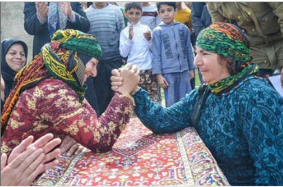
برگزاری جشنواره بازی‌های بومی و محلی گلونی در لرستان

وی بیان کرد: اولین جشنواره بازی‌های بومی و محلی خانگی برگزار شده است.