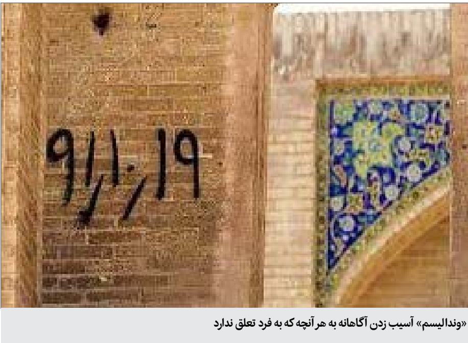
«وندالیسم» آسیب زدن آگاهانه به هر آنچه‌که به فرد تعلق ندارد

آنچه‌که به فرد تعلق ندارد، است، این دیگری می‌تواند عمومی مانند میراث فرهنگی، منابع طبیعی، محیط زیست و شهرداری باشد همچنین می‌تواند به صورت آسیب زدن به افراد نمود پیدا کند. وندال‌ها معمولاً از ابزارها و وسایل مختلفی برای آسیب رساندن به موارد ذکر شده استفاده می‌کنند و موضوعات مختلفی را در معرض تخریب عمدی یا وندالیسم قرار می‌دهند. به نظر می‌رسد وندالیسم یکی از مشکلات جوامع شهری است که