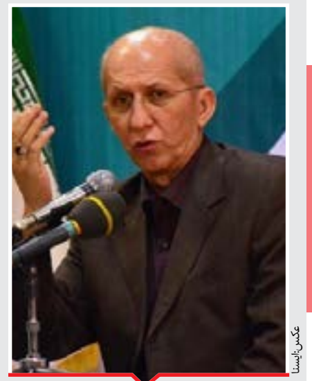
نماینده مردم تهران: اجازه ندهید دلال بازی به مجلس کشیده شود

احکام قضایی برای برگزارکنندگان کاروان آموزش گنج‌یابی فرمانده یگان حفاظت میراث فرهنگی کشور از صدور احکام سنگین قضایی برای برگزارکنندگان کاروان آموزش میدانی گنج‌یابی خبر داد.