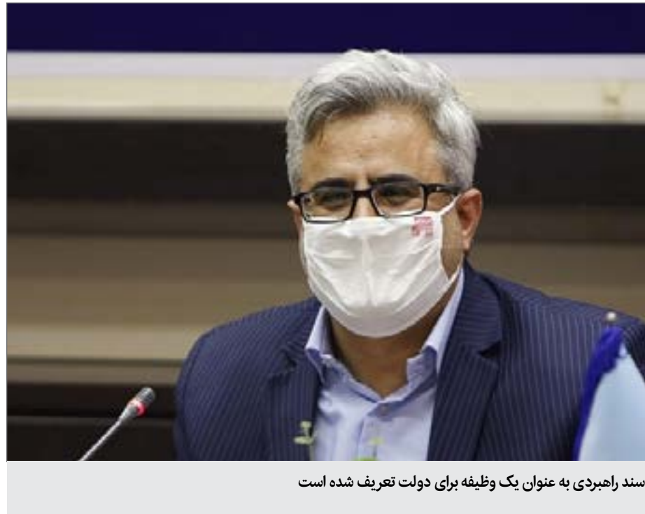
سند راهبردی به عنوان یک وظیفه برای دولت تعریف شده است

او با اشاره به اینکه پس از انقلاب برای توسعه گردشگری نقشه راه میراث‌آریا درباره اهمیت سند راهبردی توسعه گردشگری که به تازگی به تصویب هیئت دولت رسید، بیان کرد: «توسعه گردشگری نیاز به نقشه راهی داشت که مورد حمایت