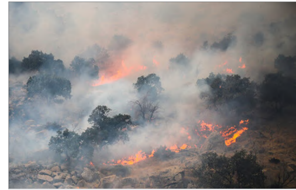
وقوع آتش سوزی جنگل‌ها و مراتع خائیز