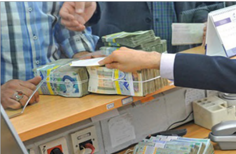
درحال حاضر بیش از ۲ هزار پرونده گردشگری متقاضی تسهیلات جبرانی خسارت کرونا در نوبت پرداخت بانک‌ها قرار دارد

حمایتی گردشگری برای جبران خسارات ناشی از شیوع ویروس کرونا، توضیح داد: طبق مصوبه دولت، تسهیلات جبرانی خسارت کرونا با دو مبلغ متفاوت به دو گروه تعلق می‌گیرد؛ دسته ای که با حکم دولت و ستاد کرونا، همزمان با شیوع این ویروس تعطیل شده بود و حالا از ۱۶ میلیون تومان وام بهره‌مند می‌شوند و گروه دومی که با حکم دولت و یا مصوبه رسمی تعطیل نبودند اما به ناچار و یا اختیاری تعطیل شدند که مشمول ۱۲ میلیون تومان تسهیلات می‌شوند.