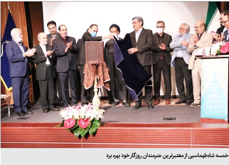
خمس شاهنامه‌اسمی از معتبرترین هنرمندان روزگار خود بهره برد

آیین رونمایی از بازنشر نسخه نفیس «خمس» نظامی، «شاهنامه اسماعیلی، سرپرست فرهنگستان هنر، در ابتدای این مراسم گفت: سنت کتاب‌آرایی در تاریخ هنر ایران سابقه‌های دیرینه دارد. از میان متون کهن فارسی، شاهنامه فردوسی، خمسه نظامی، به گزارش ایسنا به نقل از روابط‌عمومی فرهنگستان هنر، آیین رونمایی از نسخه نفیس «خمس» شاهنامه‌اسمی» شنبه (۳۱ خرداد ۱۳۹۹) در تالار ایران فرهنگستان هنر، با حضور جمعی از هنرمندان و ادیبان و مسئولان، و با رعایت نکات بهداشتی در پی شیوع ویروس کرونا برگزار شد.