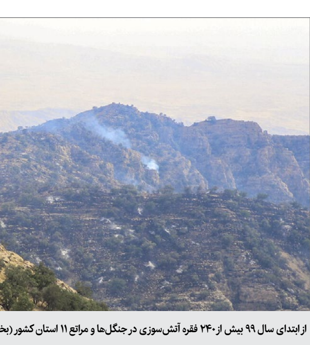
از ابتدای سال ۹۹ بیش از ۲۴۰ فقره آتش سوزی در جنگل‌ها و مراتع ۱۱ استان کشور (بخصوص در منطقه زاگرس) رخ داده است

این‌ها سازمان جنگل‌ها ضمن اشاره به ساخت آتش‌بری جدید در کشور برای اطفای حریق‌های جنگلی و مرتعی گفت: این محصول بر پایه آب است و مانع گسترش حریق می‌شود. به گزارش ایسنا مسعود منصور در حاشیه کارگاه مدیریت میدانی عملیات اطفای حریق که در وزارت دفاع برگزار شد، اظهار کرد: امروز برای مدیران کل منابع طبیعی و فرماندهان ۱۱ استانی که بیشترین حریق جنگلی و مرتعی را طی ماه‌های اخیر داشتند کارگاه آموزشی