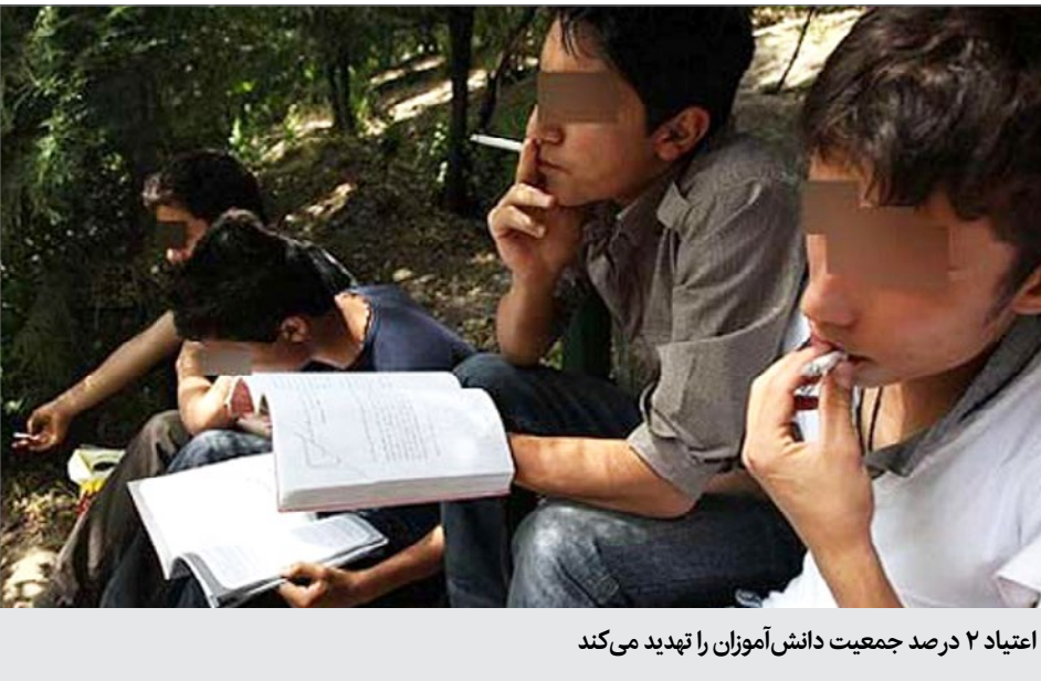
اعتیاد ۲ درصد جمعیت دانش‌آموزان را تهدید می‌کند

به گفته دبیرکل ستاد مبارزه با مواد مخدر تعداد شهدای ما ۵۶ درصد نسبت به سال ۹۷ کاهش یافته، تعداد جانبازان هم ۶۰ درصد کمتر شده است. همچنین کشفیات سلاح، خودرو و توقیف خودرو نسبت به سال قبل افزایش یافته و تلفات و کشته اشراز نیز بیشتر شده است. همچنین مصدراه اموال بیش از ۵۰ درصد رشد داشته است. شناسایی اموال قاچاقچیان نیز بیش از ۱۰۰ درصد افزایش یافته است. بنابر اظهارات وی، قیمت مواد مخدر در فروردین ۹۸ در مقایسه با فروردین سال ۹۹ بیش از ۵۰ درصد افزایش داشته است.