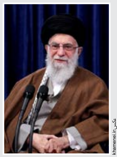
رهبر انقلاب : مبارزه با فساد ادامه یابد

آگهی‌های فروش کودکان در فضای مجازی جرم است. خانواده‌ای نسبت به خرید نوزاد اقدام کرده باشد، مرتکب جرم شده و اگر فردی واسطه این خرید و فروش باشد جرمش بیشتر است