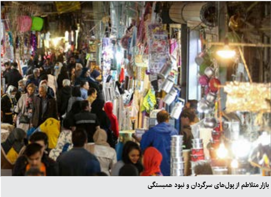
بازار متلاطم از پول‌های سرگردان و نبود همبستگی

رئیس سازمان صنعت، معدن و تجارت استان همدان با بیان اینکه منکر گرانی در بحران کرونا نیستیم، اظهار کرد: بخشی از گرانی‌ها مربوط به بحران کرونا است اما بخش