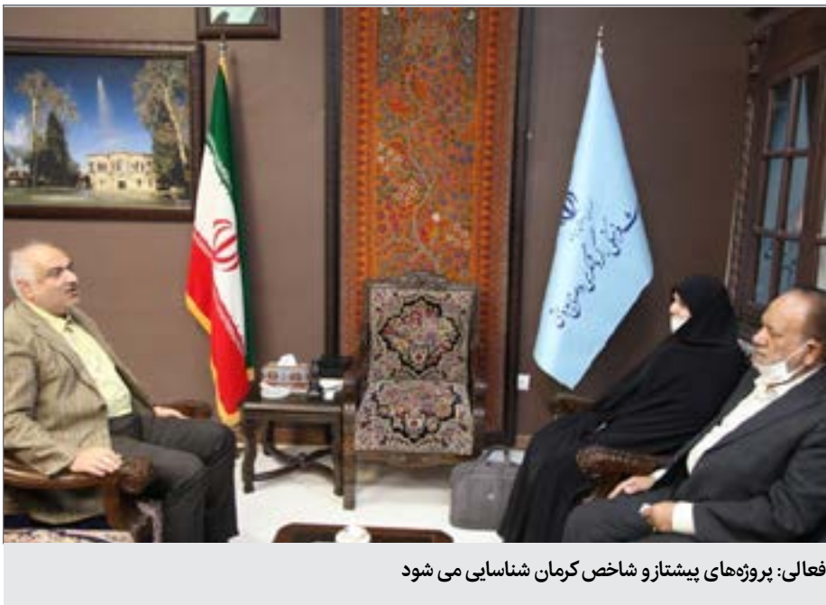
فعال: پروژه‌های پیش‌تاز و شاخص کرمان شناسایی می شود

نایب رئیس مجمع نمایندگان کرمان با اشاره به اینکه دستیابی به اهداف گردشگری استان منوط به ارائه راهکارهای عملیاتی کوتاه‌مدت، میان‌مدت و بلندمدت است، افزود: «با اینکه اغلب طرح‌های گردشگری دیربازده هستند، درآمدهای ناشی از این صنعت بر کسی پوشیده نیست و مطمئناً اگر سرمایه‌گذاران از حمایت خوب و مناسبی برخوردار باشند وارد این صنعت خواهند شد.» او با بیان اینکه صنعت گردشگری کرمان باید از سوی مسئولان استانی بیشتر مورد توجه قرار گیرد و