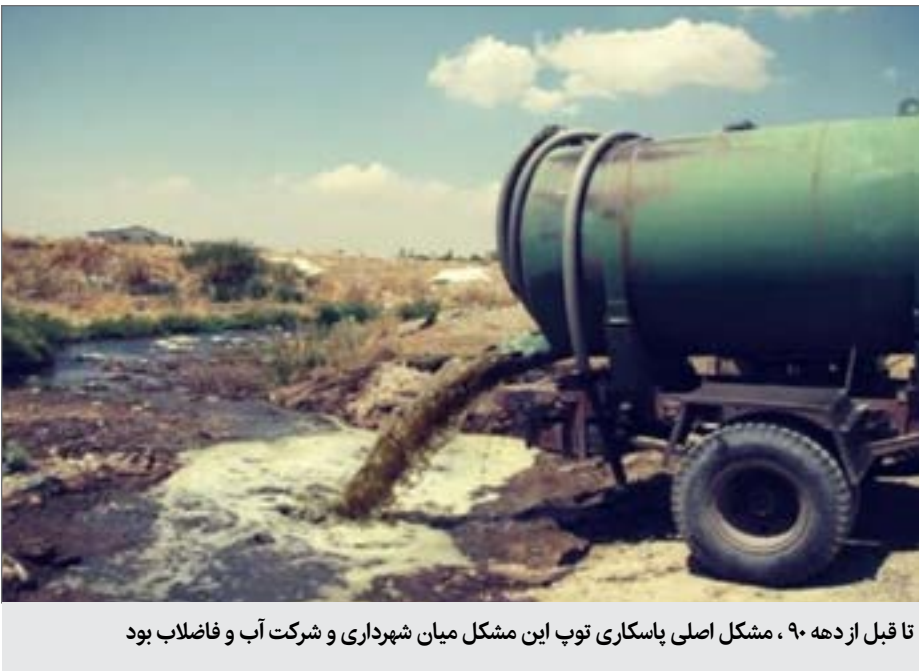
تا قبل از دهه ۹۰ ، مشکل اصلی پاسکاری توپ این مشکل میان شهرداری و شرکت آب و فاضلاب بود

تا قبل از دهه ۹۰ ، مشکل اصلی پاسکاری توپ این مشکل میان شهرداری و شرکت آب و فاضلاب بود. شهرداری طی سال های سال بر این اعتقاد بود که طبق بند ۴ ماده ۲ قانون مدیریت