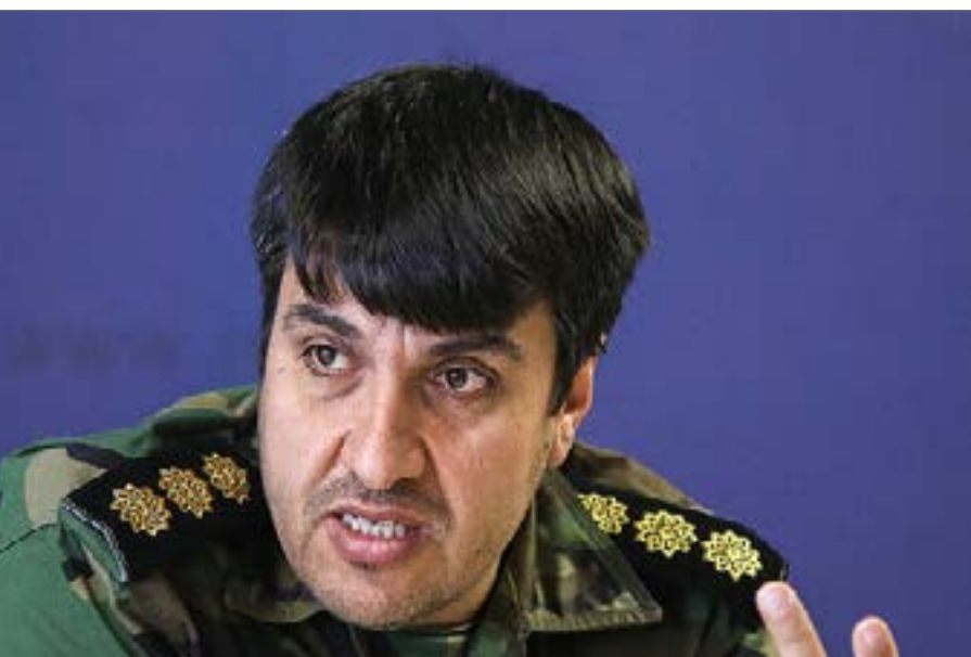
۱۶۵۴ هکتار از مناطق حفاظت شده محیط زیستی تاکنون درگیر آتش‌سوزی بودند