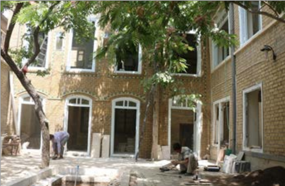
کاربری تعریف شده و ۱۶ میلیارد اعتبار برای مرمت و احیاء اختصاص یافته است

اگرچه از تاریخچه و سیر تحولات این بنا جز موارد محدودی مستندات شفاهی، اطلاع دقیقی در دست نیست اما شهرت بنا و نام آن به خاندان ساکن آن با نام شجره «پیشه‌وران»