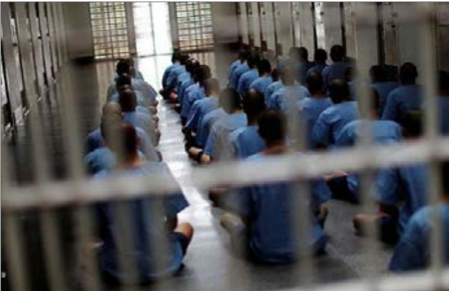
افزایش ۲۱ درصدی کشفیات انواع موادمخدر را در سال ۹۸ شاهد بودیم

به گزارش ایسنا، ستاد مبارزه با مواد مخدر درحالی فعالیت‌های خود در سال ۹۸ را به پایان رسانده است که از جمله مهم‌ترین اقدامات آن افزایش ۲۱ درصدی