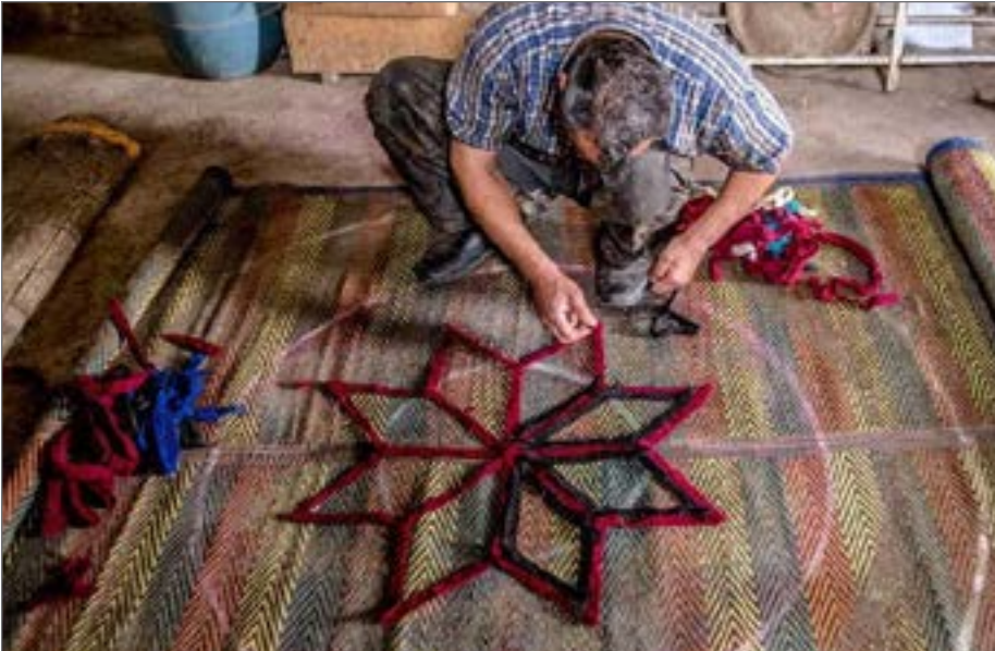
صنایع دستی و مشاغل مربوط به قالی‌بافی بیش از دو میلیون و ۵۰۰ هزار شغل در ایران ایجاد کرده‌اند

صنایع دستی همواره با ویژگی‌های خاص خود به پیشرفت فرهنگی سرزمین‌ها کمک می‌کند، هنر نیز فرصت در خود فرو رفتن و