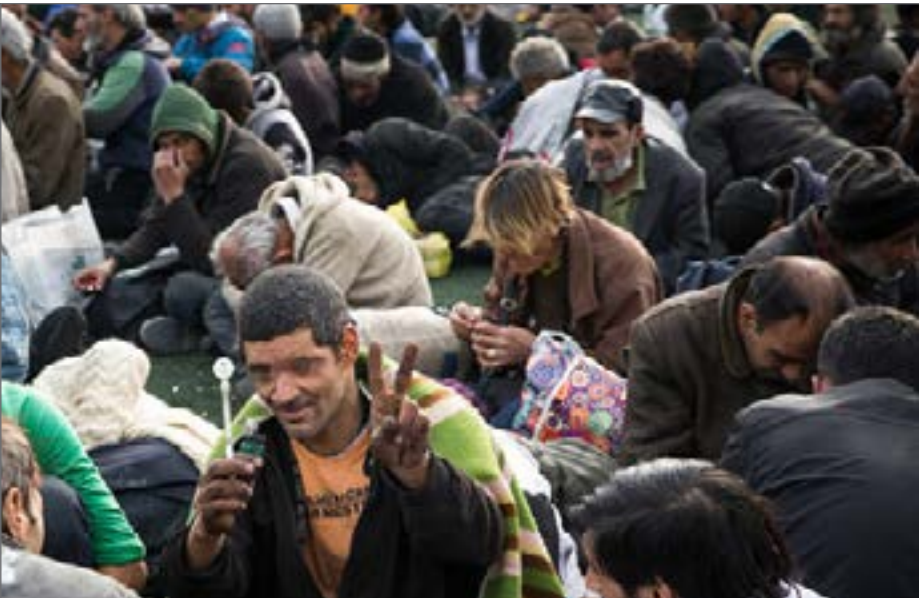
حدود سه میلیون مصرف‌کننده مستمر مواد در کشور وجود دارد

بنابر اظهارات سهرابی، همچنین بررسی گزارش ۲۰۱۹ دفتر مقابله با جرم و مواد سازمان ملل متحد نیز نشان می‌دهد که تعداد مصرف‌کنندگان مواد شبه افیونی در سطح جهان ۵۳.۴ میلیون نفر است (یعنی ۵۶ درصد بیشتر از تخمین‌های قبلی). همچنین دو