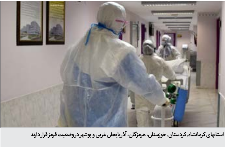
استانهای کرمانشاه، کردستان، خوزستان، هرمزگان، آذربایجان غربی و بوشهر در وضعیت قرمز قرار دارند

باید باور کنیم که کرونا فعلا قصد رفتن ندارد. همچان ناخوانده‌ای که مسیر دنیا را تغییر داده است. سبک زندگی متفاوت شده است. مدت زیادی است که احوال‌پرسی با دست دادن شروع نمی‌شود. بیش از چهار ماه از ورود این ویروس به ایران گذشته است. هر روز حدود ۲ هزار نفر به جمع مبتلایان اضافه می‌شود. مجموع همه مبتلایان در کشور هم از ۲۱۷ هزار نفر گذشته است. در همین مدت بیش از ۱۰ هزار و ۲۰۰ نفر از مبتلایان بر اثر ابتلا به کووید۱۹ فوت کرده‌اند.