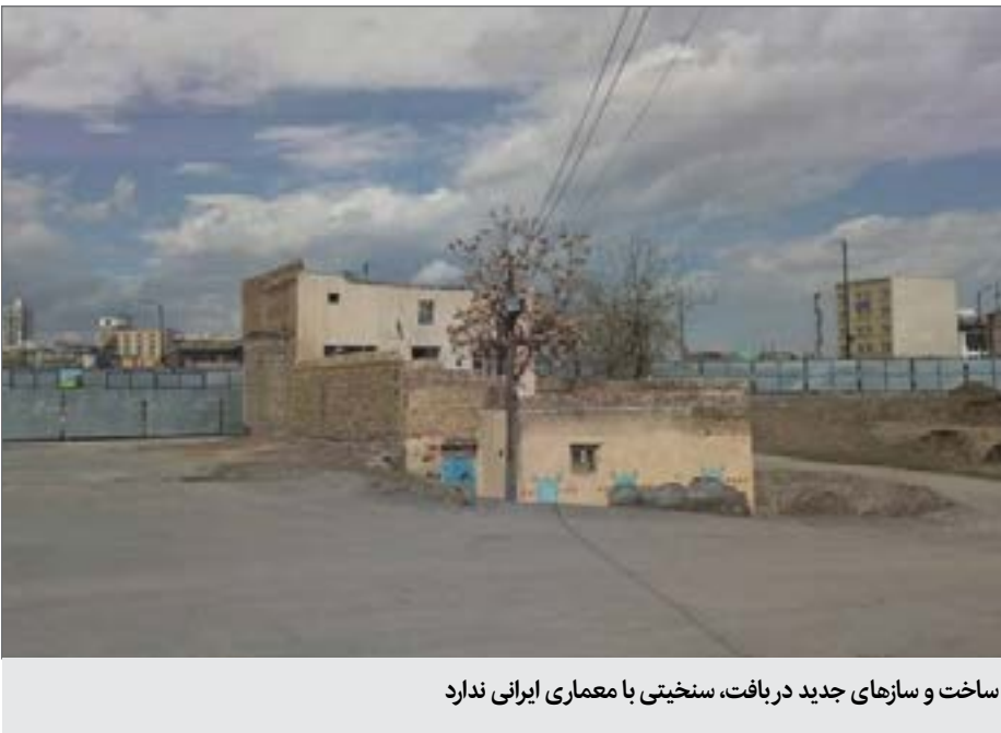
ساخت و سازهای جدید در بافت، سختی با معماری ایرانی ندارد

از حدود ۲۴ سال قبل که طرح ساماندهی و به سرانجام رساندن بافت تاریخی اطراف حرم امام رضا (ع) در دستور کار متولیان شهری و میراث فرهنگی مشهد قرار گرفت تا امروز این طرح با بایدها و نبایدهای زیادی دست و پنجه نرم کرد؛ حرف و حدیث‌هایی که هر روز بخشی از تاریخ و هویت این شهر مهم در طول تاریخ اسلام را با خطر تخریب مواجه می‌کرد و چه بناهای تاریخی که