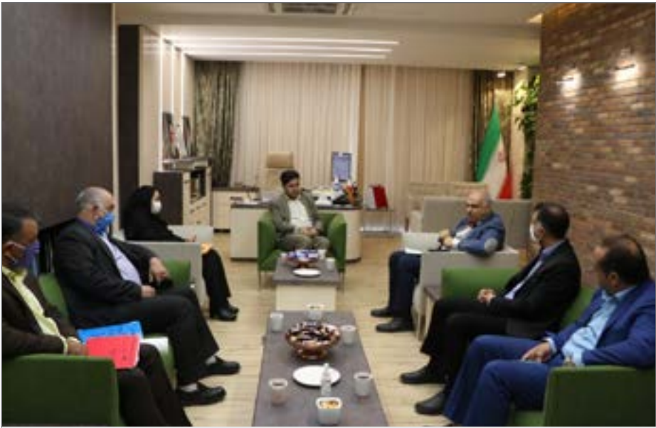
تعامل شهرداری و اداره‌کل میراث فرهنگی برای احیای بافت تاریخی

شهردار کرمان بر تشخیص کارشناسی اداره‌کل میراث فرهنگی، صنایع دستی و گردشگری برای ایجاد محور گردشگری و در نظر گرفتن اولویت‌ها در این زمینه تأکید کرد و گفت: حضور فود استریتی (دکه‌های غذاهای خیابانی) در فضاها و معابر بافت تاریخی نیز، فرصتی برای حضور