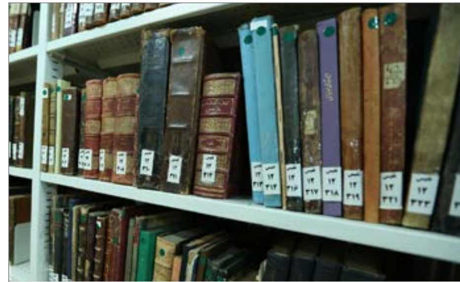
صنعت چاپ از دوران قاجار در ایران شروع شد که کتاب‌های سنگی قبل از این دوران را می‌توان به عنوان نخستین نمونه‌های چاپی، عنوان کرد

مدیرکل کتاب‌های خطی و نادر سازمان اسناد و کتابخانه ملی ایران در ادامه صحبت‌های خود با اشاره به نسخه‌های خطی موجود، گفت: تنوع در نسخ خطی یکی از ویژگی‌های داشته‌های کتابخانه ملی است که توسط اداره کل کتاب‌های خطی و نادر سازمان حفظ و نگهداری می‌شود. در واقع برخی از کتابخانه‌ها مانند کتابخانه مرعشی نجفی و یا آستان قدس رضوی به شکل تخصصی روی کتب دینی متمرکز هستند اما کتابخانه ملی ایران، کتابخانه مجلس و یا کتابخانه دانشگاه تهران، از تنوع بسیاری در زمینه نسخ خطی برخوردار