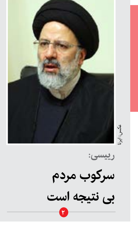
رئیس: سرکوب مردم بی نتیجه است