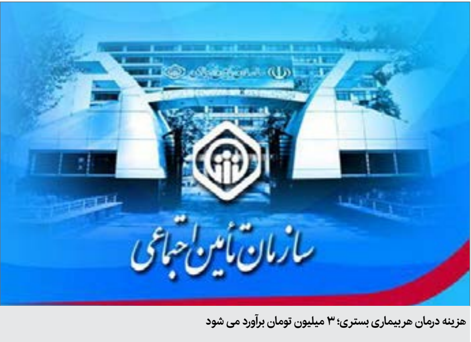
هزینه درمان هر بیماری بستری؛ ۳ میلیون تومان برآورد می شود

درمان بیماران مبتلا به کرونا توسط سازمان تأمین اجتماعی و حجم گسترده‌ای از فعالیت‌ها در این ایام باعث شده است که مصارف مالی بخش درمان سازمان در سال ۱۳۹۸ به مرز ۳۱ هزار میلیارد تومان، یعنی حدود ۶۰۰۰ میلیارد تومان بیشتر از بودجه مصوب این بخش برسد. به گزارش ایسنا، با آغاز رشد شتابان شیوع ویروس از اوایل اسفندماه ۱۳۹۸ و نیاز به افزایش