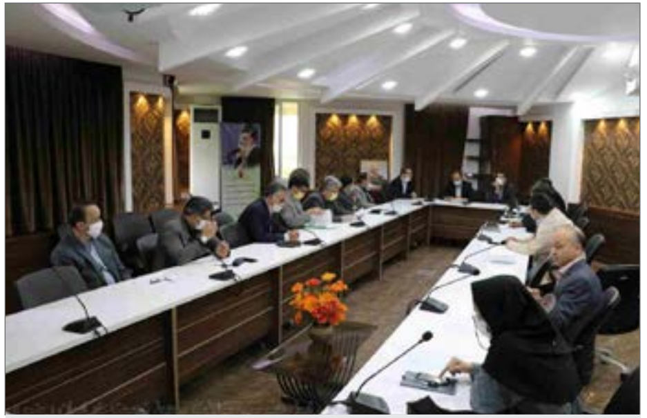
مدیر کل حفاظت محیط زیست خراسان رضوی خبر داد: تقاضای ۱۴۳ واحد آبکاری برای انتقال به شهرک صنعتی