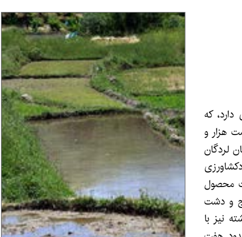
جهاد کشاورزی به سمت کشت محصولات کم آب بر و جایگزین بروند.