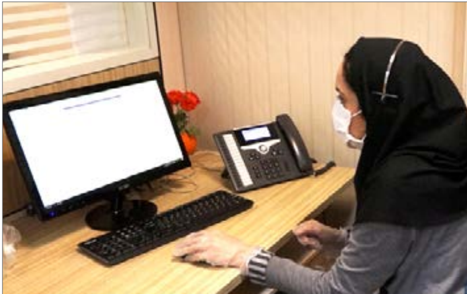
یکی دیگر از اهدافی که مراکز مثبت زندگی دنبال می‌کنند افزایش رضایتمندی افراد است

برای توسعه فعالیت از جمله تأسیس و بهره‌برداری از این مراکز است. سرپرست دفتر بازرسی و مدیریت عملکرد سازمان بهزیستی کشور با بیان اینکه گروه‌های هدف به ظرفیت و ساری‌کنیه، اظهار کرد: در مدیریت عملکرد تأکید زیادی بر روی نظارت و شفافیت وجود دارد. خوشبختانه این جامعه هدف قرار داشته باشد و بتواند در راستای ارتقای سلامت اجتماعی، دسترسی‌ها هم ایجاد شده باشد.