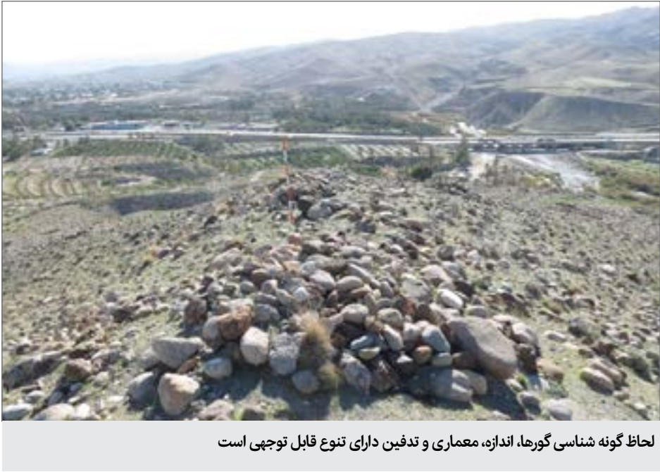
لحاظ گونه شناسی گورها، اندازه، معماری و تدفین دارای تنوع قابل توجهی است