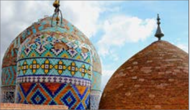
مسجد جامع بروجرد

الله و طرح ایجاد موزه‌های جدید در بقعه شیخ صفی‌الدین اردبیلی از قبیل موزه باستان‌شناسی بخش سکه و بخش اسناد را از دیگر طرح‌ها در این مجموعه عنوان کرد.