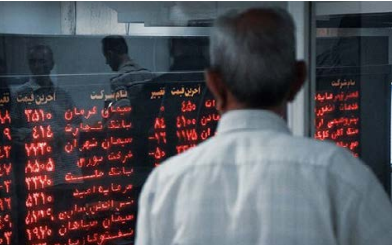
مشتریان بازار سرمایه روزهای ریزش بورس را می‌گذرانند. آیا این بازار را به مقصد بازار دلار ترک می‌کنند؟

عبدالناصر همتی سه‌شنبه در پستی اینستاگرامی با اشاره به تعطیلی بسیاری از صرافی‌ها و مراکز جابه‌جایی ارز به دلیل پیشگیری از کرونا، از تأمین ۲.۵ میلیارد دلار ارز از طریق بانک مرکزی و صادرکنندگان غیرنفتی در این مدت خبر داد. وی پیش‌بینی‌ها درباره تورم و شرایط آتی ارزی کشور را دور از پیش‌بینی بر مبنای واقعیت‌ها و اطلاعات در دسترس عنوان کرد و درباره عرضه ارز به روال گذشته نوشت: «با احیای مجدد و تدریجی روند صادرات غیرنفتی و نفتی، پیش‌بینی بانک مرکزی از برگشت وضعیت طبیعی صادرات غیرنفتی و عرضه ارز به روال گذشته حکایت می‌کند. در کنار همه این موارد، موضوع دسترسی به منابع بانک مرکزی در خارج از کشور نیز روند مثبتی پیدا کرده است.» وی همچنین درباره ریسک سرمایه‌گذاری در ارز اظهار داشت: «مردم عزیز این حق را دارند که منابع و دارایی خود را در بخش‌های مختلف نظیر بورس، بانک، املاک، ارز و طلا سرمایه‌گذاری کنند، ولی این وظیفه را دارم که ریسک سرمایه‌گذاری در ارز را مجدداً