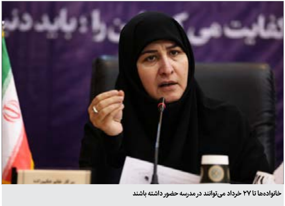
خانواده‌ها تا ۲۷ خرداد می‌توانند در مدرسه حضور داشته باشند

مسئول ستاد ثبت نام وزارت آموزش و پرورش در سال تحصیلی جدید با بیان اینکه مدارس هیئت امنایی مدارس دولتی هستند و فقط می‌توانند هزینه فوق برنامه را دریافت کنند گفت: اگر خدماتی در این مدت ارائه نشده باید هزینه را