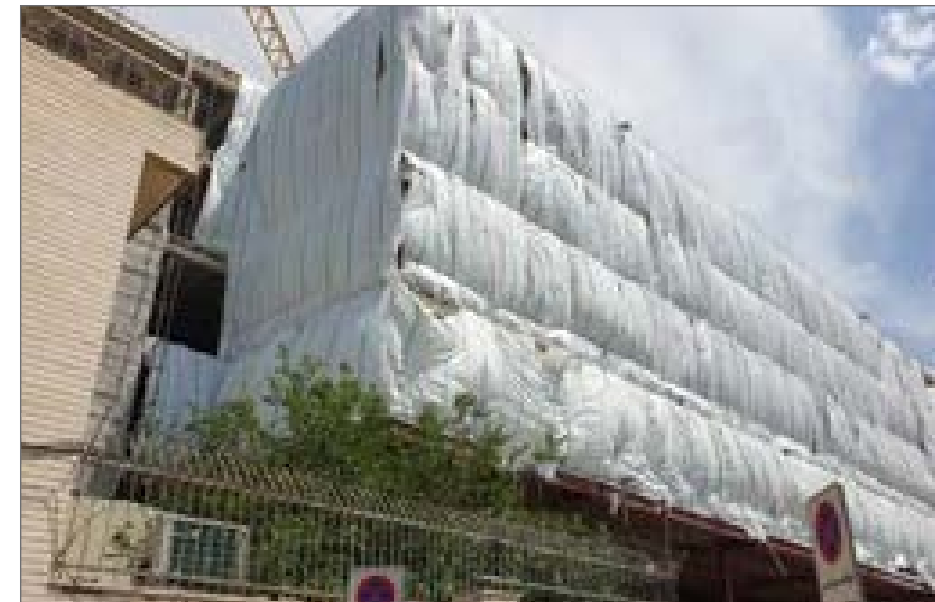
با ساخت این هتل، «هویت معماری و شهرسازی اصفهان» در معرض خطر قرار می‌گیرد

زیرچهار باغ عباسی، احداث گذرآقا نجفی، مشکلات رخ داده در مرمت گنبد مسجد شیخ لطف‌الله و طرح‌های پیاده‌راه چهارپایه عباسی به مرور صدای اعتراض فعالان میراثی را بلند کرده تا این روزها که احداث هتل‌های جدید در حریم چهارپایه عباسی این بار نگرانی معماران را برانگیخته است. اسکلت‌بندی هتل‌های جدید، منظر محور فرهنگی تاریخی اصفهان را مخدوش کرده است، محوری که حداکثر ارتفاع بناهای قرار گرفته در آن نباید بیشتر از هشت متر باشد و عرصه و حریم تا شعاع ۱۰۰ متر باید از حداقل ارتفاع اثر تاریخی مجاور