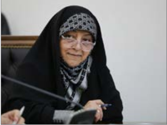
سید علی الهیار ترکمن

معاون رییس جمهوری در امور زنان و خانواده گفت: آخرین ایراد شورای نگهبان به لایحه حمایت از اطفال و نوجوانان سه هفته قبل در مجلس رفع شد و منتظر تایید نهایی هستیم. «معصومه ابتکار» روز جمعه در صفحه شخصی خود در توئیتر در واکنش به تویت «هادی طحان نظیف» عضو حقوقدان شورای نگهبان نوشت: «ممنون از نکات شما. لایحه حمایت از اطفال و نوجوانان سال‌ها را کد مانده بود و با تقاضای اولویت دولت دوازدهم دوباره فعال شد. با پیگیری دولت آخرین ایراد شورای نگهبان سه هفته قبل در مجلس رفع شد و منتظر تایید نهایی هستیم. این لایحه حتما می‌تواند به قضات در مواردی مانند رومینا کمک کند.»