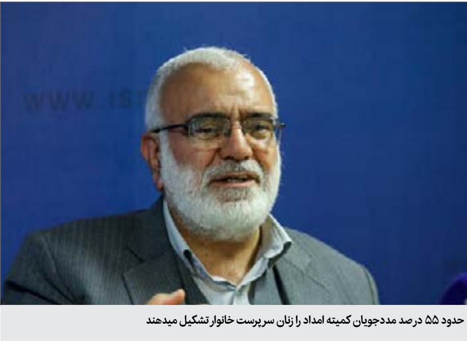
حدود ۵۵ درصد مددجویان کمیته امداد را زنان سرپرست خانوار تشکیل میدهند

وی با بیان اینکه طی سالیهای گذشته طرح افطاری ساده در مساجد برگزار می شد، افزود: امسال به دلیل محدودیت های اجرای پروتکل های بهداشتی مقابله با کرونا، طرح اطعام مهدوی با هدف توزیع غذای گرم میان نیازمندان اجرا شد که یک کار متفاوت بود و با مشارکت خوب مردم و خیران، تاکنون