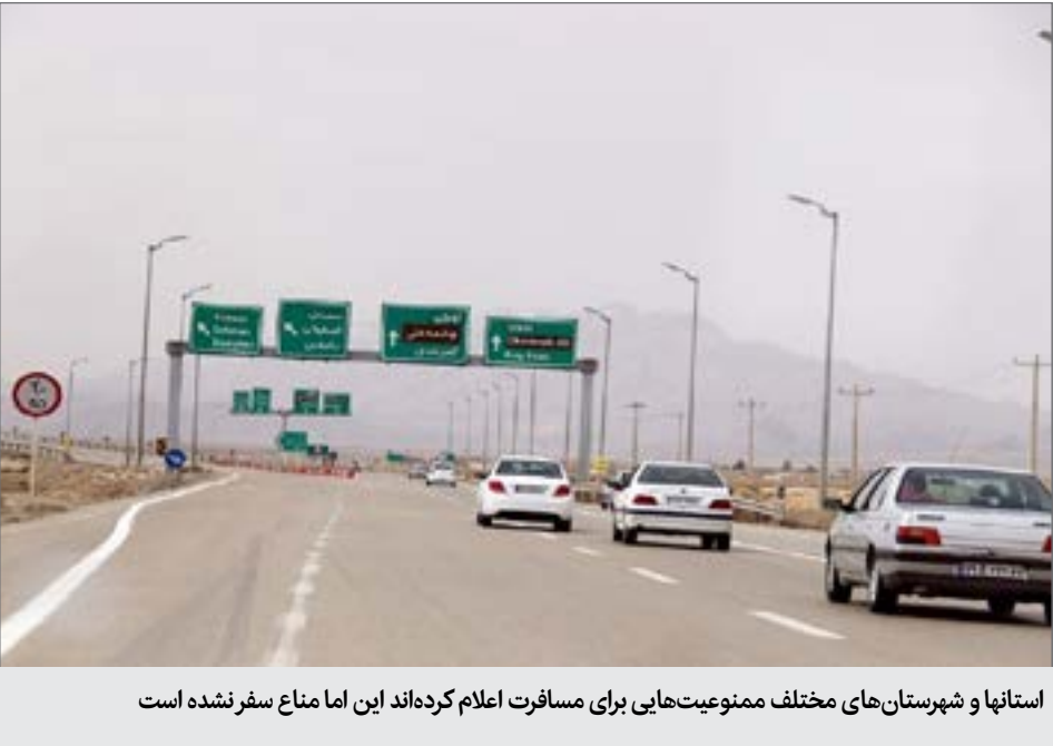
استانها و شهرستان‌های مختلف ممنوعیت‌هایی برای مسافرت اعلام کرده‌اند این اما منع سفر نشده است