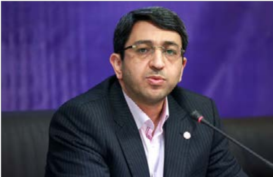
امسال مشاوره ژنتیک برای خانواده‌هایی که دارای دو معلول و بیشتر دارند، انجام می‌شود.

با روز ملی جمعیت، گفت: در شرایطی که سر می‌بریم که طبق آمار اعلام شده در سال ۹۸ نرخ رشد جمعیت به زیر یک درصد کاهش یافته است. همانطور که می‌دانید در جوامع امروزی نیروی انسانی و جمعیت هر کشور یکی از مولفه‌های قدرت آن کشور است و می‌تواند پتانسیلی برای ایجاد قدرت اقتصادی و اجتماعی در سطح هر جامعه‌ای باشد. وی افزود: اگر در آینده نزدیک میزان جمعیت کشور ما به آن میزانی که باید نرسد و همچنین میانگین سنی جمعیت بر اثر