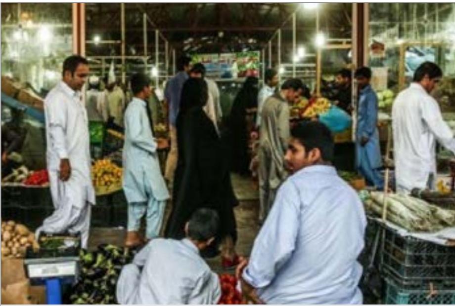
جولان کرونا و افزایش لحظه ای و جهشی آمار مبتلایان و فوت شماری از آنان وضعیت شهرهای سیستان و بلوچستان را از این لحاظ نه تنها سفید نکرده بلکه در حال نزدیک کردن به قرمز است.

دکتر هاشمی شهری اظهار داشت: ما به دنبال بیماریابی هستیم تا سریعتر چرخه