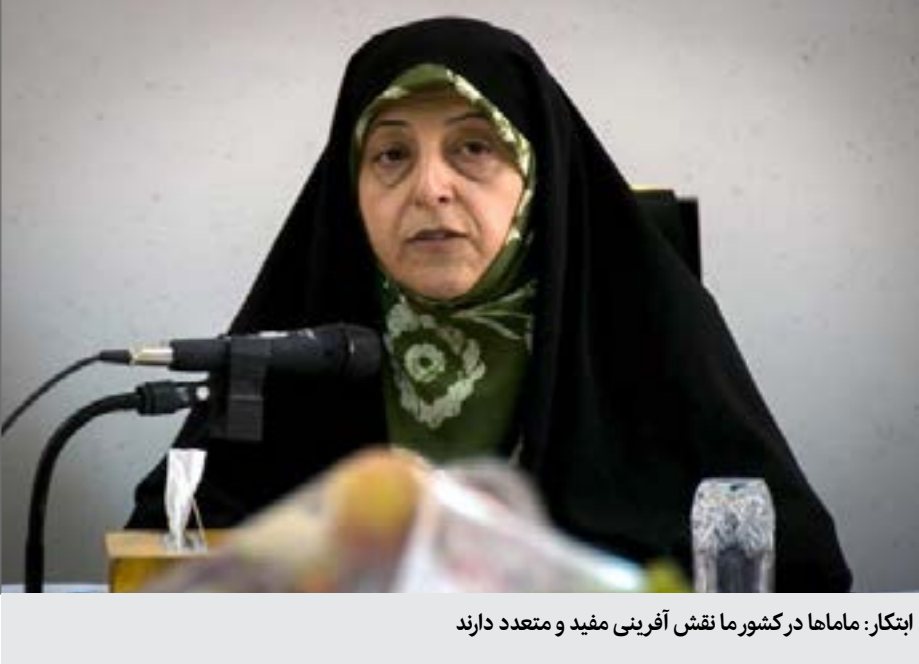
ابتکار: ماماها در کشور ما نقش آفرینی مفید و متعدد دارند

معاون رئیس جمهوری در امور زنان و خانواده معتقد است که اگر بتوانیم درک کارشناسانه و آماری از وضعیت خانواده داشته باشیم، می‌توان فرصت‌ها و هم تهدیدات پیش روی خانواده ایرانی را تبیین کرد و در کنار آن برنامه‌ریزی خوبی برای وضعیت خانواده داشت و در این راستا نیز مسئولیت دستگاه‌ها را تعریف و وضعیت خانواده را به طور مستمر رصد و پایش کرد، زیرا در حال حاضر هرچقدر درباره خانواده صحبت می‌کنیم کلی‌گویی است و آمارها چندان دقیق نیست، اما شاخص‌های خانواده به ما این امکان را می‌دهد که در سطح هر شهرستانی بتوانیم وضعیت خانواده آن شهرستان را بررسی کنیم.