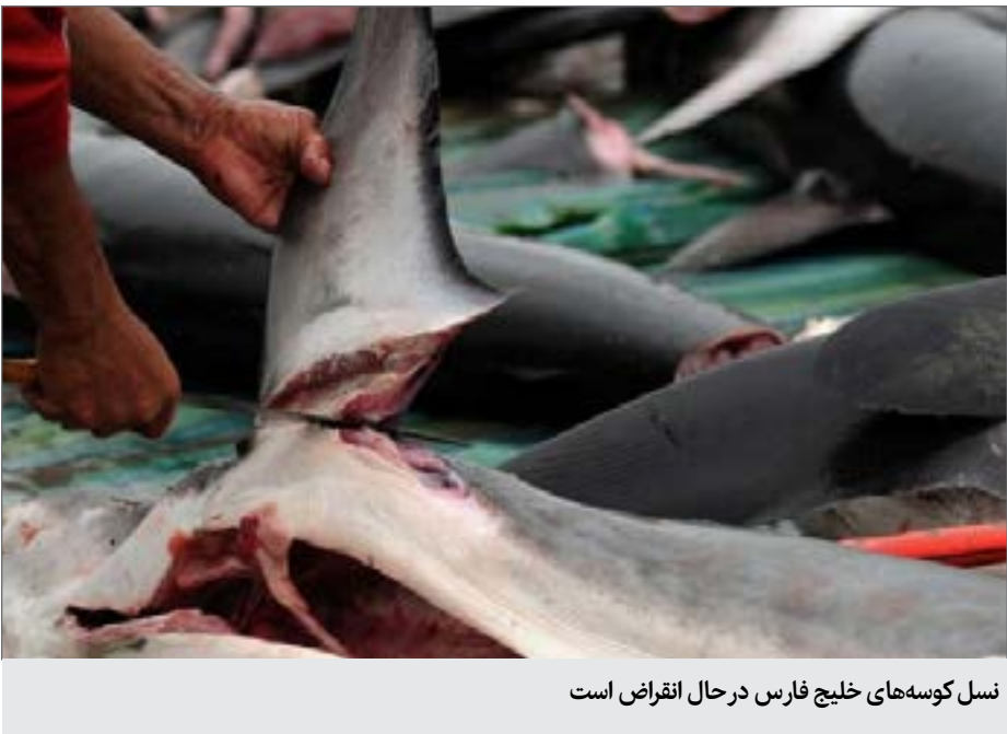
نسل کوسه‌های خلیج فارس در حال انقراض است

کوسه سرچکشی از معروف ترین انواع کوسه ها است و با توجه به ممنوعیت صید و خطر انقراض نسل این گونه از کوسه ها نیاز است که از آنان مراقبت کنیم تا به انقراض کشیده نشوند. شیلات باید نظارت بیشتری داشته باشد، هر چند هزینه چنین اقداماتی بالا است اما لازم است نظارت و گشت‌های دریایی بیشتر شود چرا که نحوه صید این کوسه ها و سپس قطعه قطعه کردن آنان که به یک کشتار دسته جمعی شبیه است تاسف بار