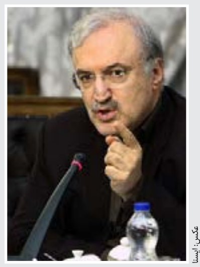
وزیر بهداشت: یک میلیارد یورو صندوق ذخیره ارزی چه شد؟

آغاز سفرهای ضروری هوشمند معاون گردشگری با تشریح اقدامات برای مبارزه با اثر کرونا در گردشگری و اقدامات آتی برای بازگرداندن شرایط گفت: پروتکل سفر هوشمند یعنی سفر همراه سلامت برای اجرا، تدوین شد.