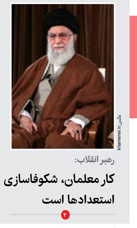
رهبر انقلاب: کار معلمان، شکوفاسازی استعدادها است