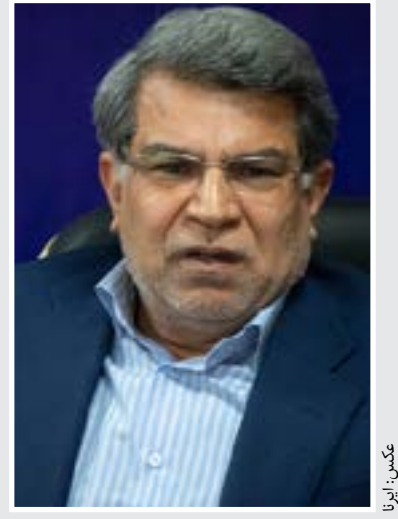
رییس سازمان خصوصی سازی: امکان ثبت نام سهام عدالت وجود ندارد

رییس نظارت بر حیات وحش اداره محیط زیست استان فارس گفت: ۲ توله خرس سرگردان در ارتفاعات شهرستان مرودشت با تلاش ماموران محیط زیست از مرگ نجات یافتند.