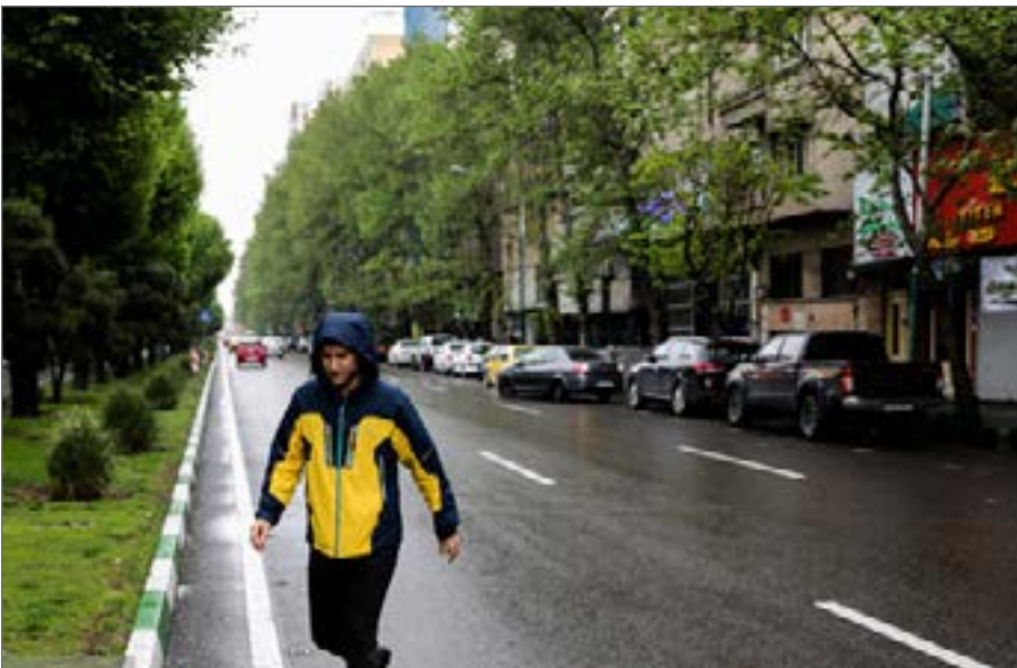
بی‌هنجاری منفی دمایی در کشور (کاهش دما نسبت به میانگین بلند مدت خود) همچنان ادامه دارد

رییس مرکز ملی خشکسالی و مدیریت بحران سازمان هواشناسی ضمن اشاره به اینکه دمای هوا به تدریج در کشور گرم خواهد شد اما با این وجود در برخی نقاط تا ۶ درجه سانتیگراد نسبت به میانگین بلند مدت کمتر است، گفت: این بی‌هنجاری منفی دمایی کماکان ادامه دارد و بارش‌ها نیز در اردیبهشت در محدوده نرمال پیش‌بینی می‌شود. احد وظیفه در گفت‌وگو با ایسنا، با