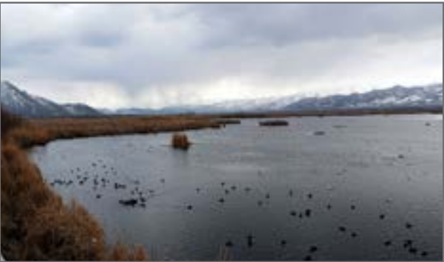
تالاب آق گل

کارشناسی دانشگاه کردستان در راستای پشتیبانی از ایجاد این مرکز و هدایت امور تحقیقاتی و مطالعاتی و ارائه طرح‌های حفاظت و احیای دریاچه شده است. وی ابزار امیدواری کرد دانشگاه کردستان با