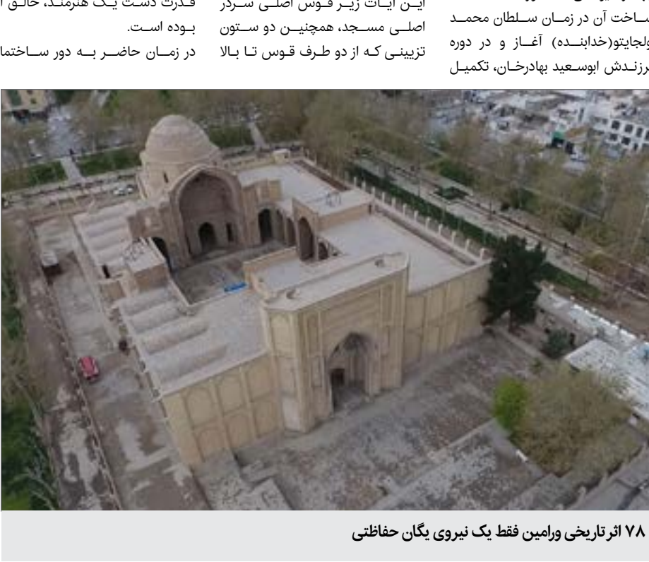
۷۸ اثر تاریخی ورامین فقط یک نیروی یگان حفاظتی

کمیود نیروی انسانی دفتر میراث فرهنگی، صنایع دستی و گردشگری ورامین باعث شده است تا مسجد جامع تاریخی این شهرستان به محلی پر تردد برای افراد معتاد و ولگرد تبدیل شود. به گزارش ایرنا، مسجد جامع ورامین از نمونه‌های کامل مسجد چهار ایوانی کشور است که ساخت آن در زمان سلطان محمد اولجایتو(خدابنده) آغاز و در دوره فرزندش ابوسعید بهادرخان، تکمیل