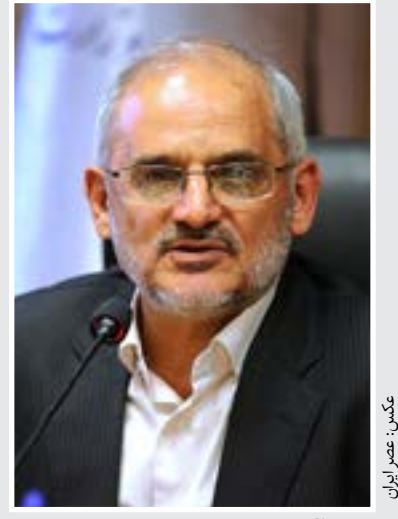
نکته: عصر ایران