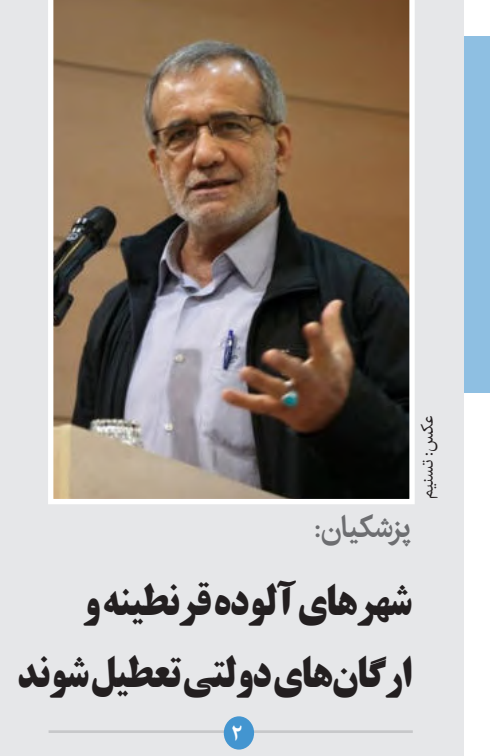
پزشکیان: شهرهای آلوده قرنطینه و از گان های دولتی تعطیل شوند

نیاز قلعه «بارده» چهارمحال و بختیاری به مرمت بارش های اخیر در چهارمحال و بختیاری باعث تخریب بخشی از قلعه بارده در چهارمحال و بختیاری شده است و این قلعه نیازمند مرمت و بازسازی است.