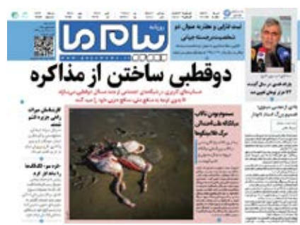
دوقطبی ساختن از مذاکره