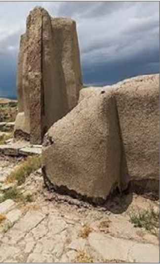
نمای کلی از آثار تاریخی

امکان باز پس گیری مکان های کتابخانه ای وجود ندارد