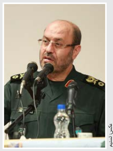
مشاور فرمانده معظم قوا: در موضع پاسخ مناسب به ترامپ خواهیم بود