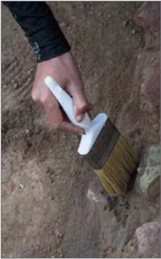
حفاظت از میراث