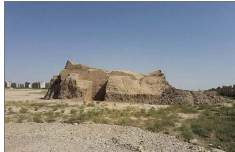
تپه ۸ هزار ساله پوئینک قرچک باید حفظ شود

استاندار تهران می‌گوید که تپه باستانی پوئینک قرچک که در مسیر کمربندی جنوبی این شهرستان واقع شده، به دلیل آن که در فهرست آثار ملی ثبت شده، باید حفظ شود و شهرداری دیگر اقدامی برای اجرای این پروژه باید طرح دیگری ارائه کند. شهرستان های قرچک، ورامین و پیشوا که از آن ها به عنوان شهرستان های جنوب شرق تهران یاد می‌شود، با جمعیتی بالغ بر یک میلیون نفر که به گفته مسئولان آن‌ها، ۲۵۰ هزار نفر آنان را اتباع بیگانه تشکیل می‌دهند، در یک امتداد واقع شده‌اند و ساکنین آن، برای رسیدن به تهران چاره‌ای جز عبور کردن از شهرستان قرچک ندارند. ترافیک شدید محور اصلی در این شهرستان باعث شد تا اعضای نخستین دوره شورای اسلامی قرچک، احداث کمربندی جنوبی را در دستور کار قرار دهند، مسیری که از میدان شهید ستاری آغاز و پس از ۶ کیلومتر به میدان پوئینک متصل می‌شود.