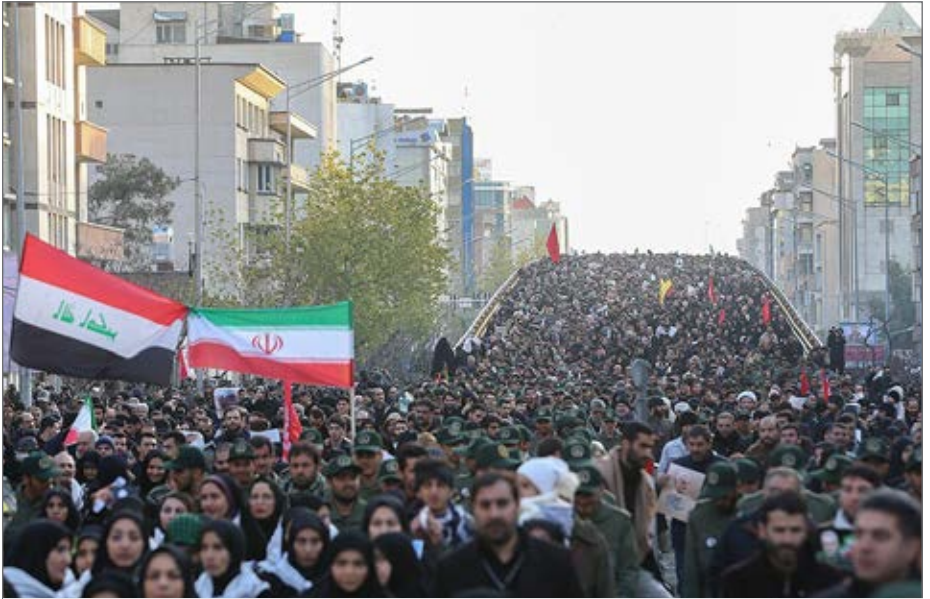
حضور میلیونی مردم پایتخت از همه تفرکات در تشییع سپهبد سلیمانی

حضرت آیت‌الله خامنه‌ای صبح دیروز با حضور در دانشگاه تهران با چشمانی اشکبار تشییع میلیونی از دانشگاه تهران به سمت