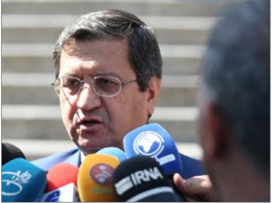
رئیس کل بانک مرکزی

رییس کل بانک مرکزی گفت: این بانک از هیچ تلاشی برای خنثی سازی فشار حداکثری به مردم ایران و برای حفظ و تداوم ثبات در بازار ارز و پول و نیز سایر بازارها، فروگذار نخواهد کرد.«عبدالناصر همتی» روز دوشنبه با انتشار یادداشتی در صفحه شخصی خود در شبکه اجتماعی اینستاگرام، نوشت: امروز ۱۶ادی ماه ۹۸، یکی از حماسی ترین و باشکوه ترین رخدادهای تاریخ انقلاب اسلامی بود. خیل عظیم مردم، از همه‌گرایش‌ها و تمام کسانی که به کشورشان واهداف انقلاب اسلامی ایران اواقمند هستند برای تشییع و تجلیل از قهرمان ملی خود، سردار سرفراز مقاومت اسلامی، حاج قاسم عزیز به میدان آمدند.وی افزود: خون شهید سلیمانی فصل جدیدی از عظمت و شکوه ملت ایران در سراسر کشور ایجاد و همبستگی عمیق ملی راموجب شده است.رییس کل بانک مرکزی ادامه داد: این روزها و لحظات را قدر بدانیم و اتحاد و همبستگی ملی ایجاد شده را برای پیشبرد آنچه که حاج قاسم نیز یک عمر برای آن تلاش کرد، حفظ و تقویت کنیم.همتی تصریح کرد: بانک مرکزی جمهوری اسلامی ایران نیز در همین مسیر و در این مرحله از جنگ اقتصادی دشمن، از هیچ تلاشی برای خنثی سازی فشارحداکثری آنها به مردم ایران و برای حفظ و تداوم ثبات در بازار ارز و پول و نیز سایر بازارها، فروگذار نخواهد کرد.