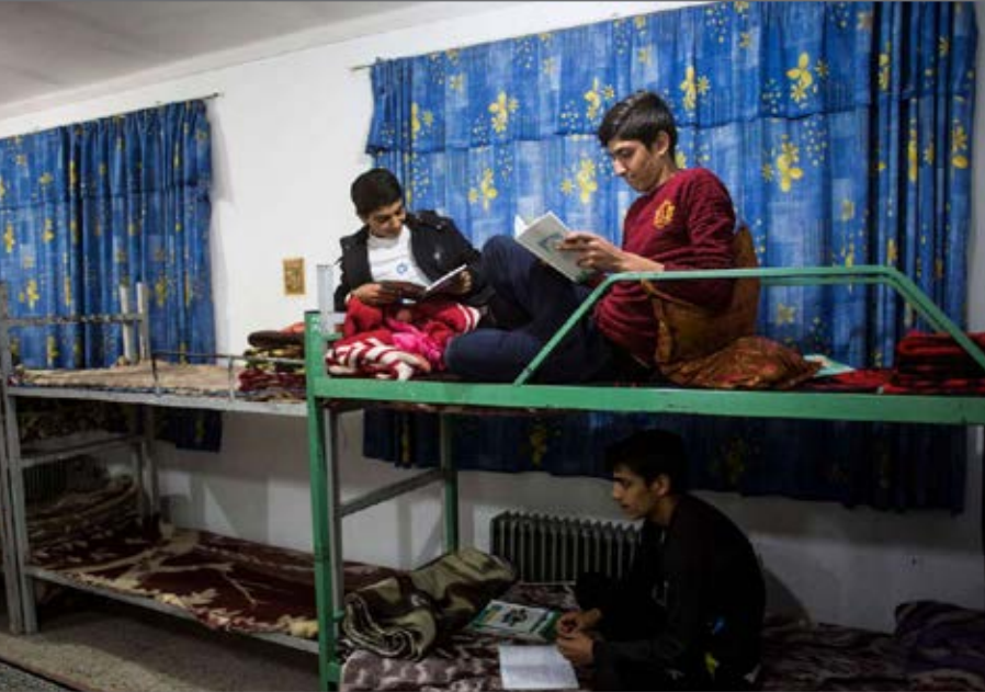
مدارس شبانه روزی، یکی از انواع مدرسی هستند که در نقاط مختلف و بخصوص دور افتاده برای دانش آموزان محروم ایجاد می‌شوند