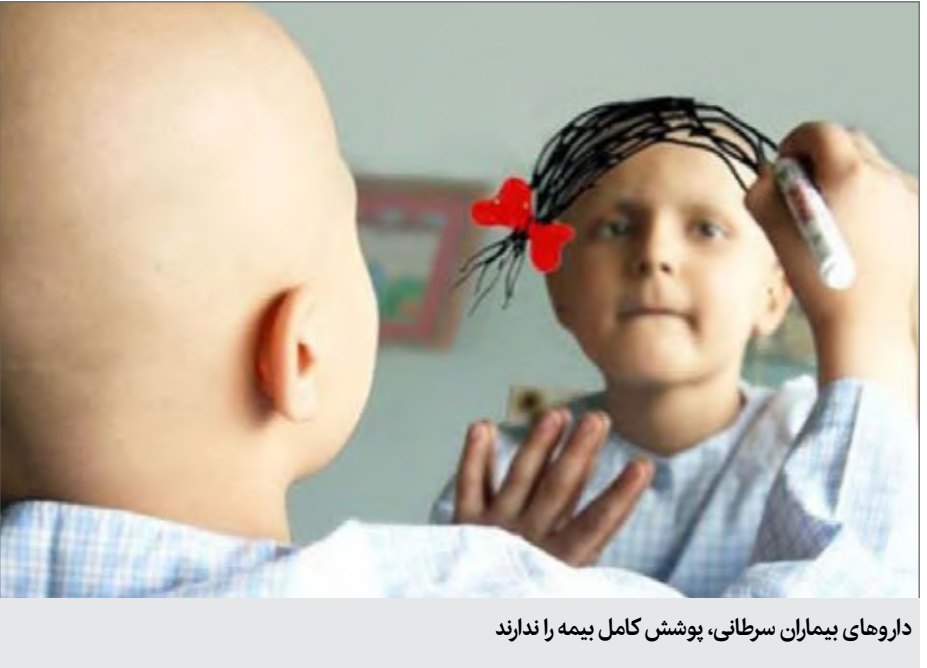
داروهای بیماران سرطانی، پوشش کامل بیمه را ندارند

این ۲ بیماری تحت پوشش بیمه قرار گرفت: تا جایی که امروز بیش از ۷۰ تا ۸۰ قلم از داروهای